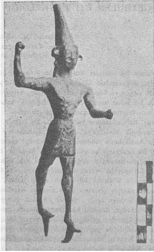
Resim 13: Dövklek köyünden getirilen Eti heykelciğinin önü

Tunçtan yapılan heykelin (En. No. 8825, resim: 13-14) boyu 12 sm. dir. Giyimi sivri külah, eteklik ve ucu kıvrık ayakkabıdan ibarettir. 2,5 sm.