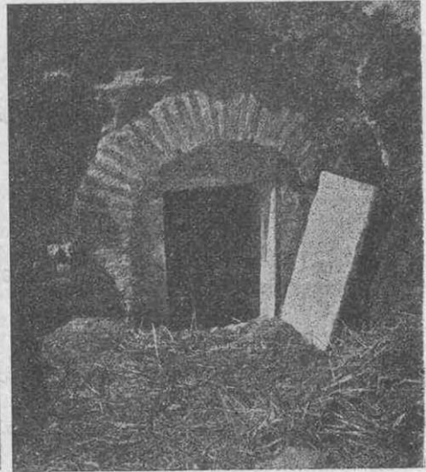
Şekil 1 a: Dış kapının yakından görünüşü