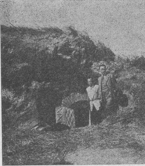
Şekil 1: Dış kapının uzaktan görünüşü