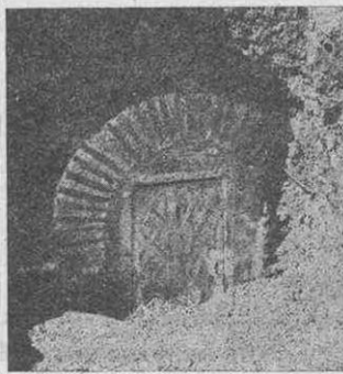
Şekil 2 a: Dış kapıyı örten mermer kapak önden