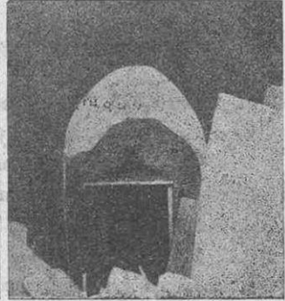
Şekil 3: Dış kapıdan iç kısımın görünüşü