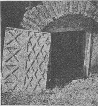
Şekil 2: Dış kapıyı örten mermer kapak arkadan