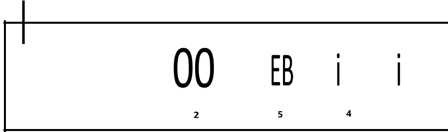
(Res. 4/ Erzurum Cunnî Mağarası'nda Orhon tipi runik tiori harfler. L " F @: