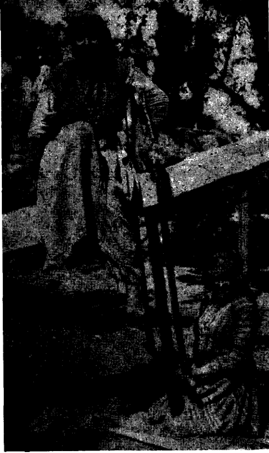
Antalya ta:htacılannndan iki kadın

halde - Kızılbaşlı!kları hesabile camia arasında hor görüldüklerinden olacak ki - tab'an mülayim ve hödük olmuşlardır. Orman ve kereste sahipleri olan müte-gallibe ağa ve tiiccann ,boyunduruğunda yaşamak, geçinmek mecburiyetinin de bu tabiat üzerinde amil olduğu şüphesizdir.