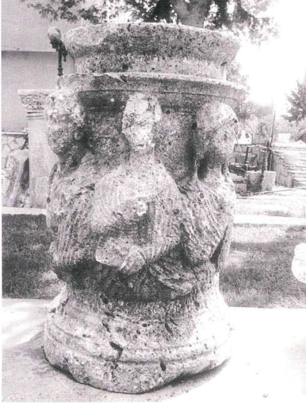
Resim 2 : 2 No.lu sunak

tablalı, tabla aşağıya doğru daralan dışbükey profillidir. Tabla altındaki üst profil önce ince bir içbükey ve altında dışbükey silme ile detaylandırılmış, gövdeye geçiş ince bir bilezik ile sağlanmıştır. Geniş bir içbükey ve altında ince torus ve kalın, düz topuk altta profillidir.