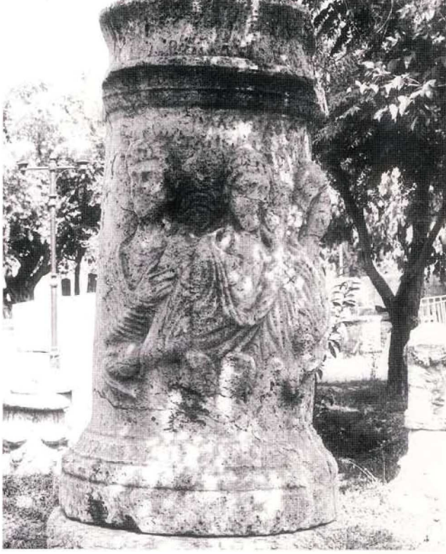
Resim 1 : 1 No.lu sunak

altında torus ve altta kalın ve düz topuktan oluşur.