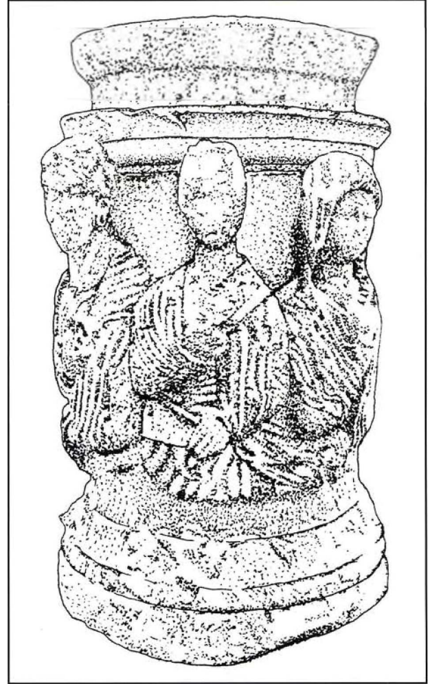
Çizim 2 : 2 No.lu sunak

Gövdede iki insan figürü bel seviyesinde