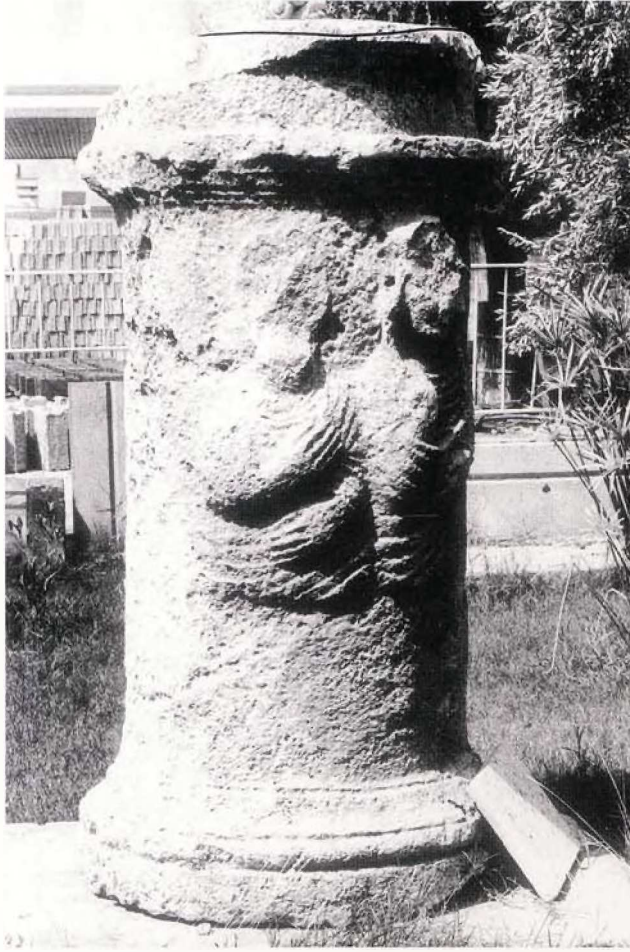
Resim 3 : 3 No.lu sunak

betimlenmiştir. Yüzleri tanınmayacak derecede tahrip olmuştur. Betimlerden sağdaki başı örtülü olanı kadın, yanındaki ise erkek figürüdür. Erkek figürünün başı tanınmayacak denli tahrip olmuş, sağ elini sol omzu üzerine doğru kaldırmış, sol eli ile de giysisinin altından karnını tutar şekilde işlenmiştir. Kadın betiminin başında uçları omuzuna dek inen bir örtü görülmektedir. Genel hatlarından oval ve etli yapıda olduğu anlaşılan yüzünün burnuna dek olan kısmı tamamen kırılmıştır, erkek figüründe olduğu gibi sağ eli ile giysi altından sol omuza, sağ eli ise karın seviyesinde bırakılmıştır. Her iki figürde de vücudu sıkıca saran giysilerde ayrıntıya özen gösterilmemiş, kıvrımlar çizgisel şematiklikte belli belirsiz ve rastgele işlenmiştir.