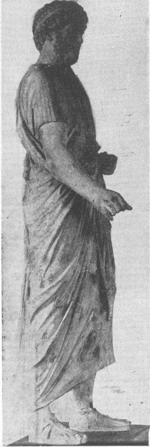
He i(elin yandan görünüü