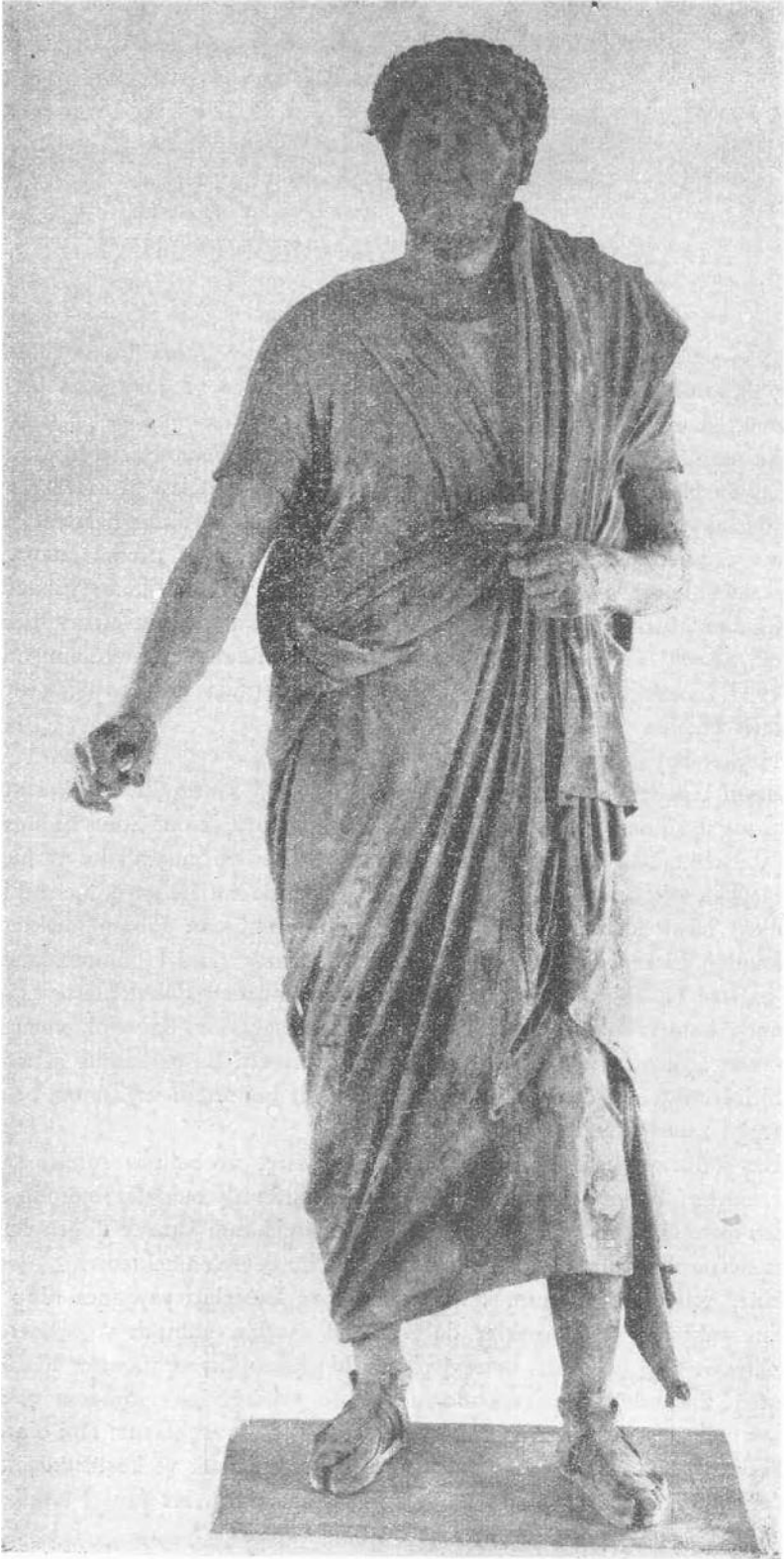
Adanacla bulunan hronz heykel