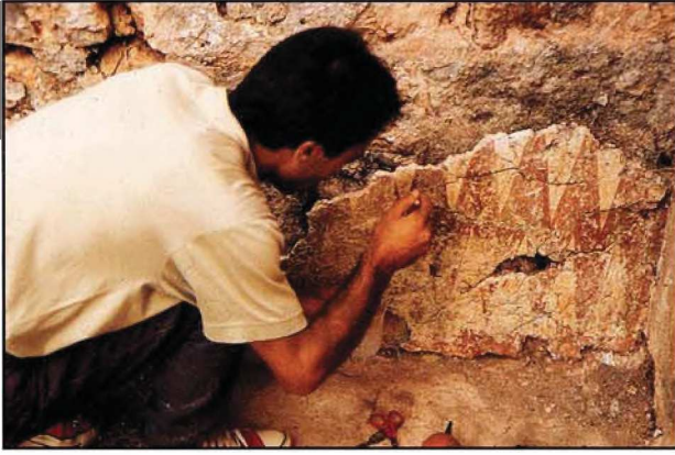
Resim : 11

görülmüştür. Bu nedenle, dökülmeye maruz büyük çatlaklı yüzeylere Paraloid B 72 aracılığıyla tülbent bezi yapıştırılmıştır (toluen içinde %25).