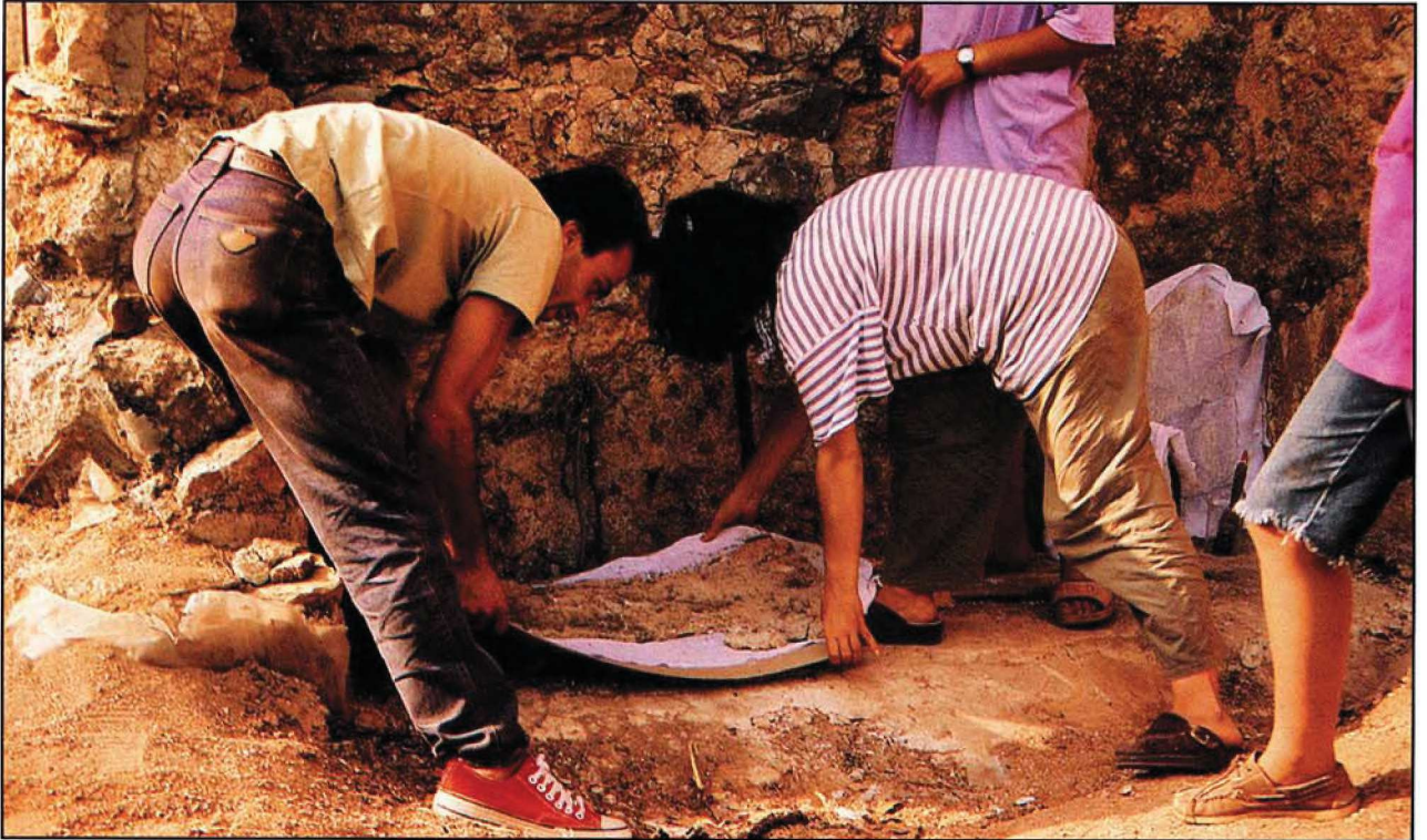
Resim : 14

Yukarıda ana hatlarıyla sunduğumuz çalışmalar, acil koruma müdahalesi olarak nitelendirilmelidir. Burada asıl amaç, in situ duvar resmi kalıntılarının daha fazla tahrip olmasını önlemek ve mevcut durumlarını güçlendirerek korumaya almaktır. Bu amaca uygun olarak yapılan sağlamlaştırma ağırlıklı çalışmalar sonrasında, tahribatı hızlandıran dış