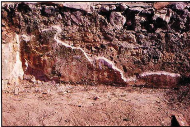
Resim : 9