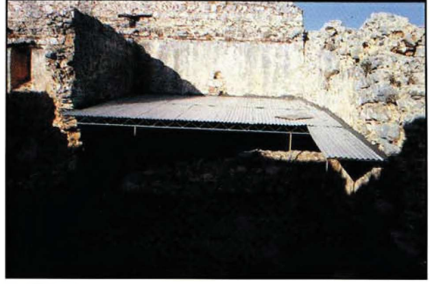
Resim : 13

4) Böylece dökülme ve parçalanma riskine karşı geçici korumaya alınan resimler, sıva tabakasıyla birlikte üstteki boşluklardan arkaya sokulan demir çubuklar yardımıyla duvardan koparılmıştır (Resim: 13).