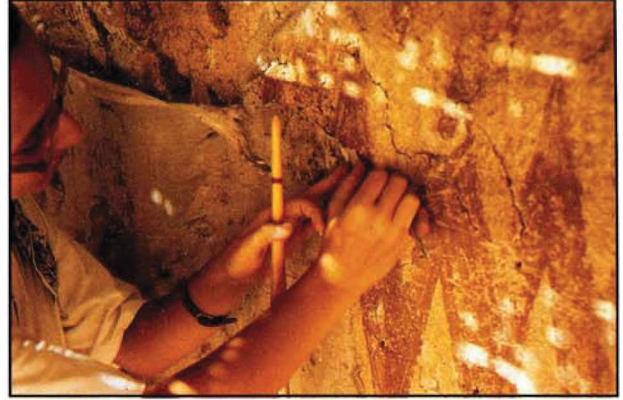
Resim : 5

Bazı daha çok tahrip olmuş yüzeylere, olası dökülmeleri önlemek amacıyla tülbent bezi yapıştırılmıştır. Üstü açık olan mekândaki resimleri dış etkenlerden korumak amacıyla, hasır ve naylon kaplı geçici bir örtü yapılmıştır (Resim: 2).