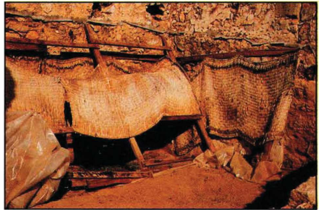
Resim : 2

Resimler, moloz taş örgülü duvarda, kaba taneli ve iri agregalı kalın ilk kat harç (arriccio) tabakasından sonra ince siva (intonaco) üzerine boyanarak elde edilmiştir. Sivanın harca iyi tutturulabilmesi için harç tabakasında derin çentikler oluşturulmuş ve siva bunun üzerine uygulanmıştır. Resimleri oluşturan desenlerin konturları, siva henüz yaş iken ince uçlu âletlerle çizilerek işlenmiştir. Konturların içinde kalan sahalara, muhtemelen siva kurumadan fresk (fresco) 5 tekniği uygulanmış ve bu sahalara fırça ile boyanmıştır. Bu resimler, açık renk zemin üzerine tek renk kırmızı boya ile boyanmış basit geometrik (zikzak) desenlerden oluşmaktadır 6 . Kompozisyon dip kısımlarda kırmızı bir bantla sınırlanmıştır. Tamamen dökülmüş olan üst kısımlarda ise, resimlerin orijinalde nereye kadar uzandığı anlaşılamamaktadır.