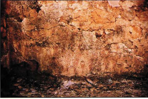
Resim : 8