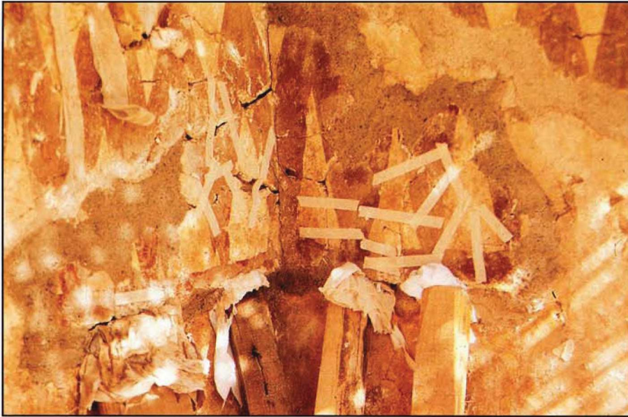
Resim : 6

6- Resimlerin bazı bölümlerine, geçici fiksasyon amacıyla 1989 yılında yapıştırılmış olan tülbent bezleri, nem ve ısı etkisiyle çürüyerek boyalı yüzeylerde lekeler oluşturmuştur (Resim: 4).