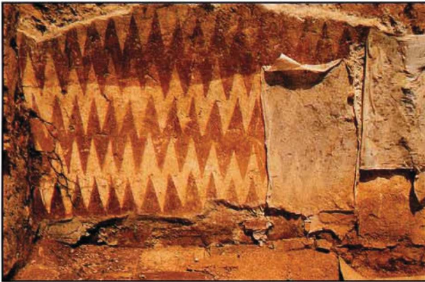
Resim : 4

Aynı mekânda, 1989 yılında devam ettirilen kazı çalışmalarıyla resimlerin devamı olan alt kısımları tabana kadar ortaya çıkmıştır. Bunların korunması ve konsolidasyonu için ikinci bir müdahale, Ali Çetin İdil sorumluluğunda bir ekip tarafından gerçekleştirilmiştir. Bu müdahalede, ayrılan sıva tabakasını taşıyıcıya bağlamak için sıva - duvar arasında kalan boşluklara sıvı harç enjeksiyonu uygulanmış; dökülen sıvaların kenarları ve aralarda oluşan boşluklar (lacuna) yeni kireç harcı ile dolgulanmıştır.