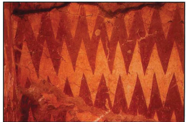
Resim : 7