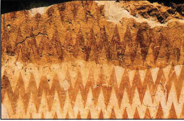
Resim : 3