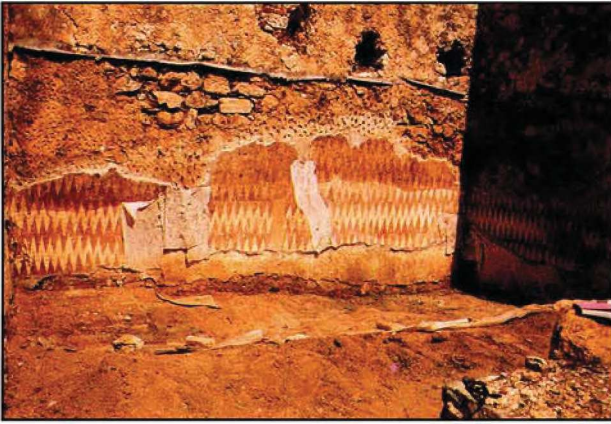
Resim : 1