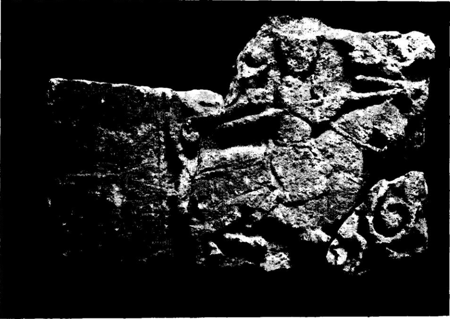
Resim 1 -- Ankara kabartması

Buraya konulan ve (Resim 1) de görülen kabartma Ankara Arkeoloji Müzesinde bulunmaktadır (No. IV, 472). Bunu bana Bay Halil Etem bildirmişti.