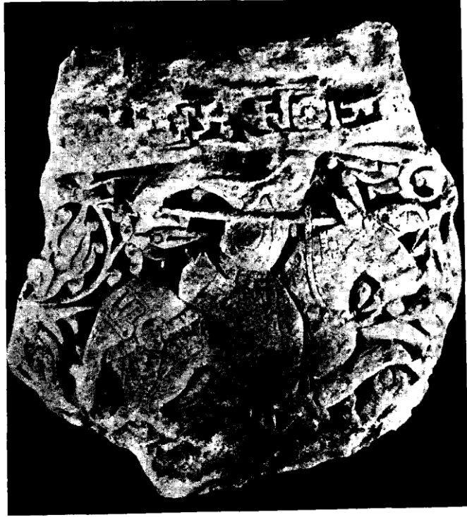
Resim 3 - Şikagodaki kabartma

üzerinde atını sağa doğru dörtlal koşturan mızraklı bir atlı görülür [']. Bunda da rensolann teşe külleri bize sağ tarafta bir ikinci atlının bulunmuş olması fikrini verir. Kabartmayı yukarsında sınırlıyan süslü kenar, tıpkı Konya kabartmasındaki gibi muhafaza olunmuştur. Bunun da maddesi Stükten imiş. Her halde burada da Ankara kabartmasının eşi olan bir teknik görülür. O da bu kabartmanın yapılışında tatbik olunan kesme ve cisimleme ameliyesinde, Stzygowski'nin dediği «Derinlik karanlığı» yani derin gölgeli bir zemine karşılık olmak üzere tesirli bir surette aydınlık bir yüzey üretilmiş oluyor. Diğer taraftan Stükten yapılmış ve zannolunduğuna göre, bir kalıptan baskı ile çıkarılmış olan ve belki de sonradan üzerinde el ile işlenen Konya kabartmasında yumuşak ve daha az