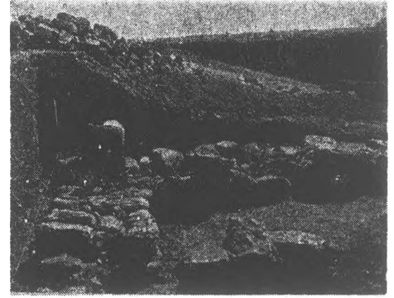
3 Polernll kapı, sol burç temel duvarların bulunuşu