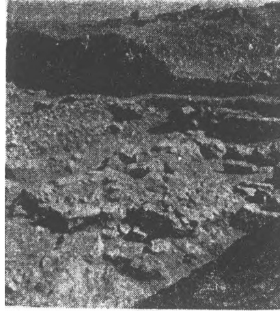
2 - Kuzey yönünde Frlg çağı mimari buluntular