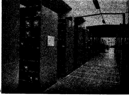
Res. 4 -fşveç Folklor, Arşivi'nden bir gö