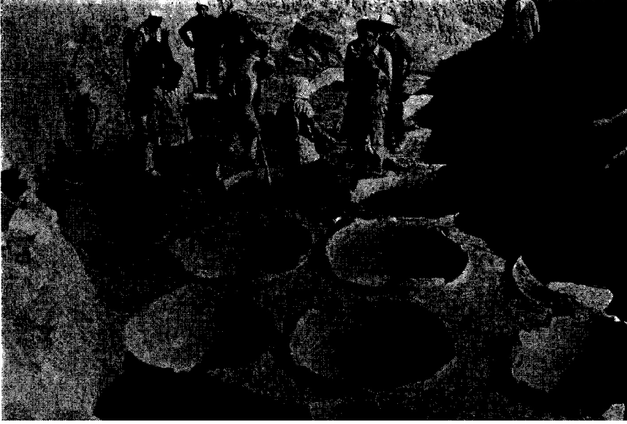
Res. 3 - "Pithoslu Mekan" (kuzeyden).