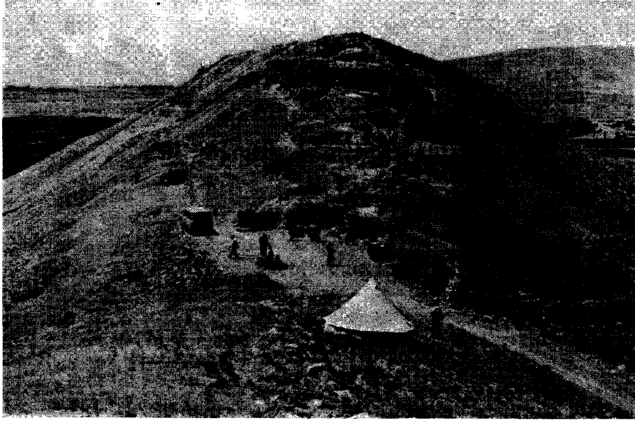
Res. 1'- Çavuş/epc="Uç kâlî" ile "Çifte Ram pAalar" arasında'ki iskan alanı = $ * &@ "İtinatlı Yollar" (Doğudan). ; ' NE; ># O'