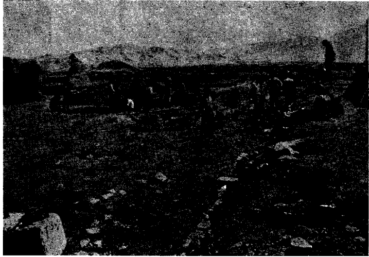
Res. 5 - Van kalesi, I No'lu sondaj alanından genel görünüş.