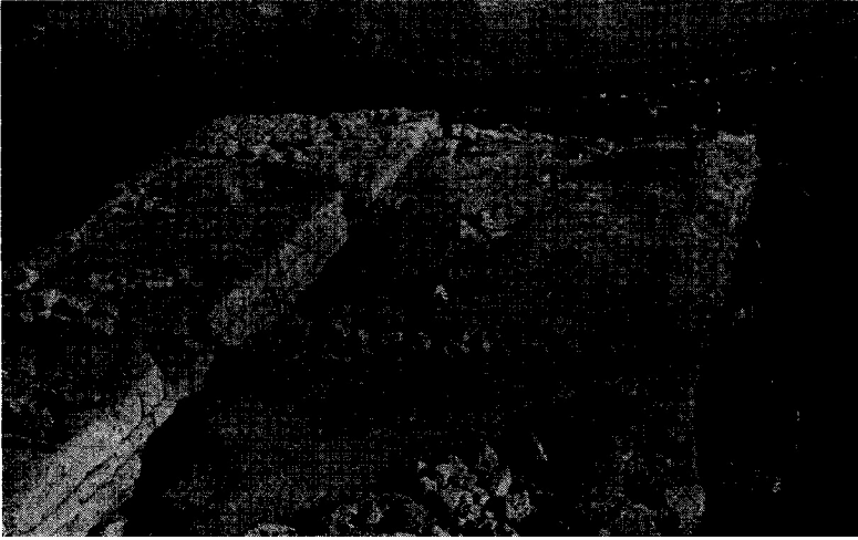
Res. 4 - "Madır burç" genel görünüş (güneyden)