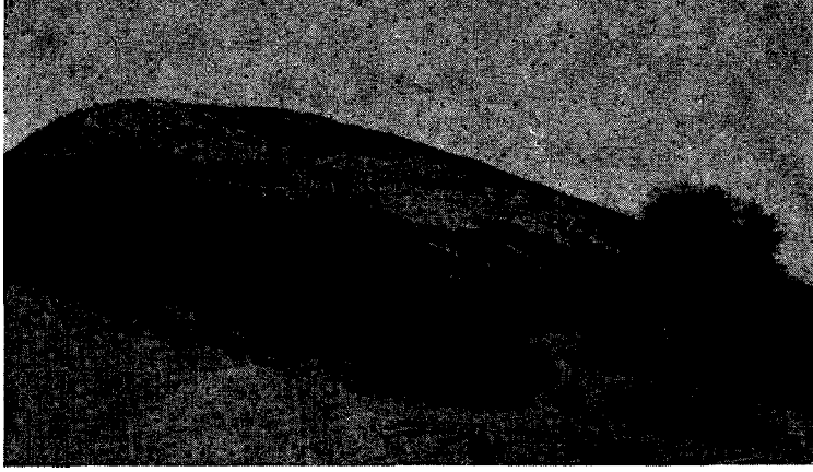
"Res. 1 - Kurt Ka*ya dađ7ının ve Kuşini mermer ocađının umumi görünüşü 73