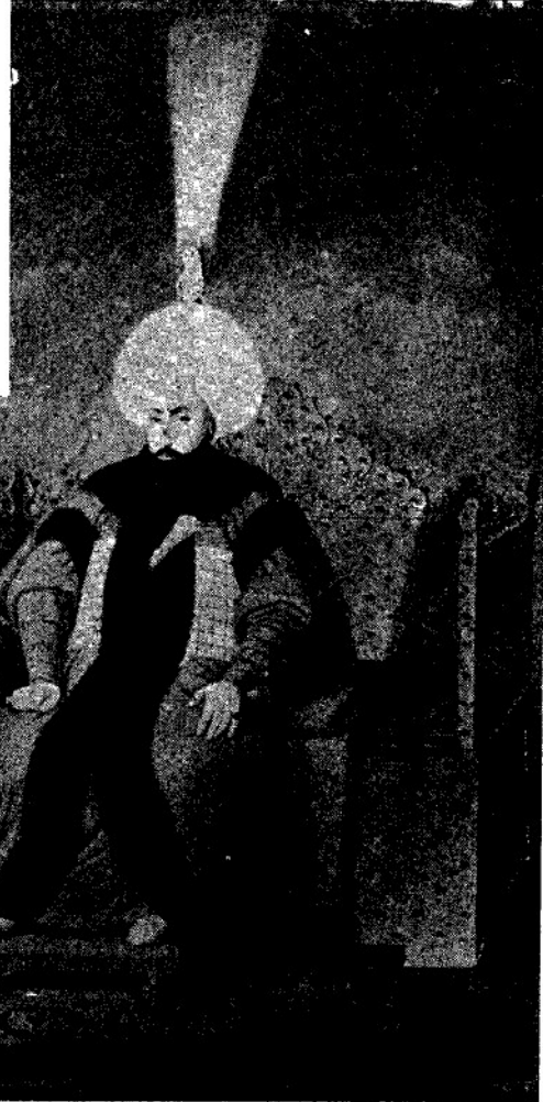
Resim: 4. Mustafa IV (1807 - 1808) Ba:yram Tahtında (T. K. S. Portre Galerisi No. 17/63)