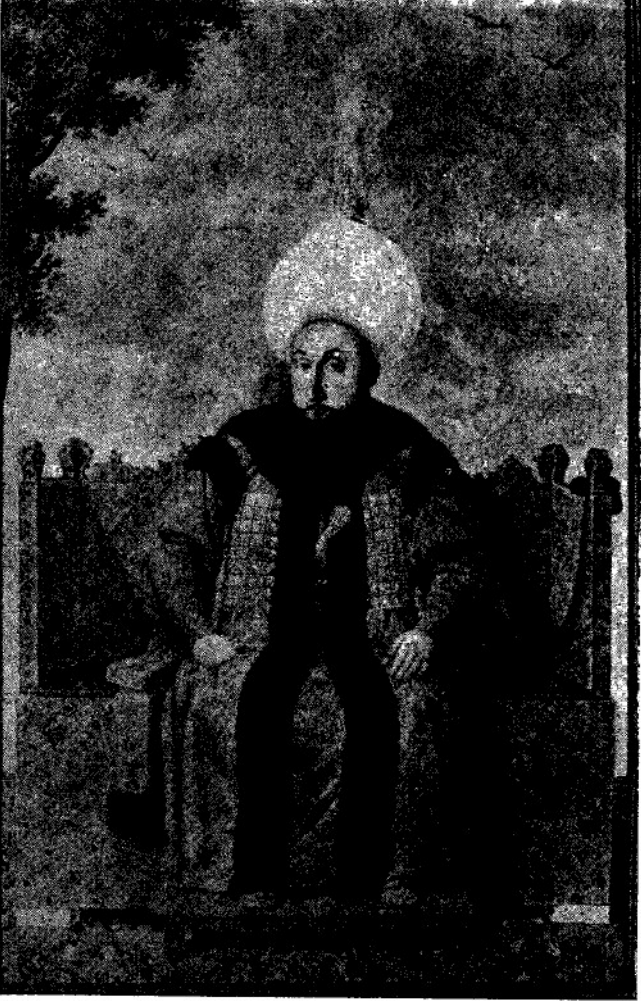
Resim: 3. Mustafa III (1757 -1774) Bayram Tahtı:ı-a (T. K. S. Portre Galerisi 17/20)