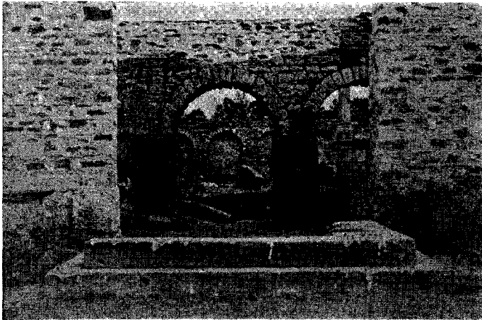
Fig. 1 - Le Mausole pres de l'Aqueduc: vue de l'interieur, du côté Nord: en premier plan, le tombeau à cbapelle.

Fig 2) - Sondages stratigraphiques sous le niveau géométrique de l'Agora: l'édifice quadrangulaire de l'Age du Bronze, au datu duquel on voit les édifices circulaires, et les tombeaux elliptiques de l'époque géométrique