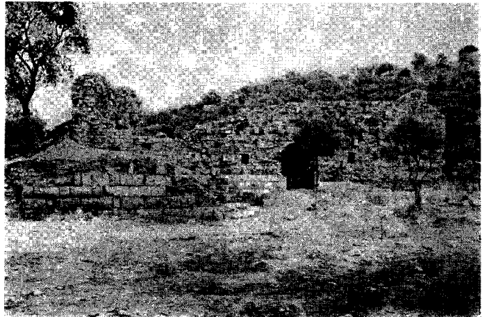
Fig. 5 - A gauche, la tour Sud - Ouest de l'enceinte du IV e siècle; à droite, vue extérieure du côté Ouest du Bouleuterion.