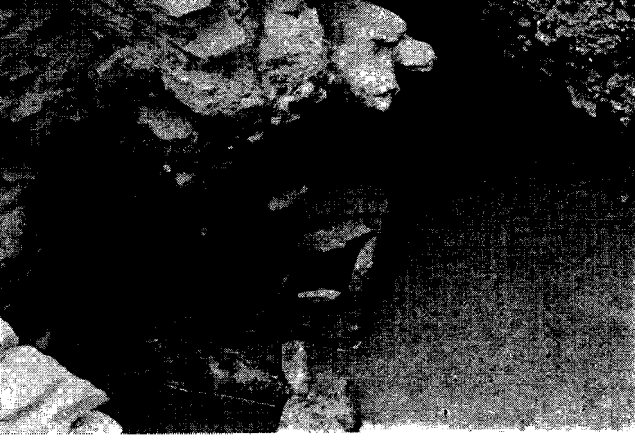
Fig. 8 - Un vase prehistorique (d fouille au