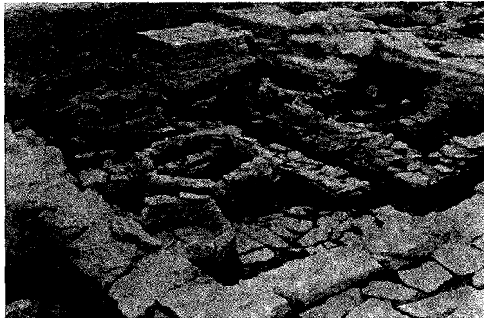
Fig 2) - Sondages stratigraphiques sous le niveau géométrique de l'Agora: l'édifice quadrangulaire de l'Age du Bronze, au datu duquel on voit les édifices circulaires, et les tombeaux elliptiques de l'époque géométrique