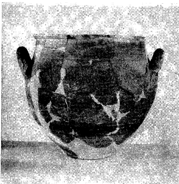
Fig. 3 - Un vase de la necropole géométrique au dessous de l'Agora.