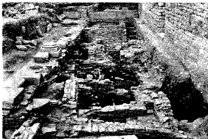
Fig. 6 - Sanctuaire d'Artemis Astias: vue d'ensemble de la fouille devant les exedres d'Artemis et d'Aphrodite.