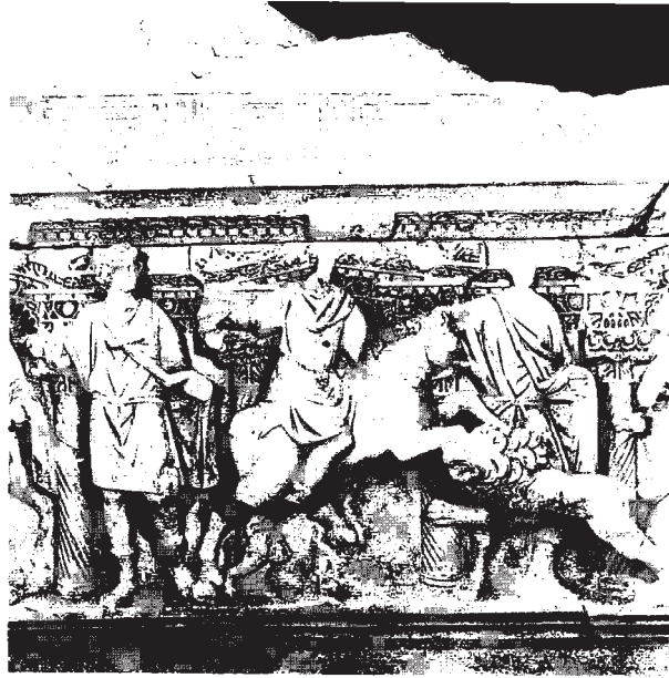
Resim 8: Av sahnesinden detay görünüş (dioskur-avcı ve arslan)