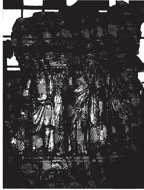
Resim 12: Kısa sol cephe gymnasium sahnesinin genel görünüşü