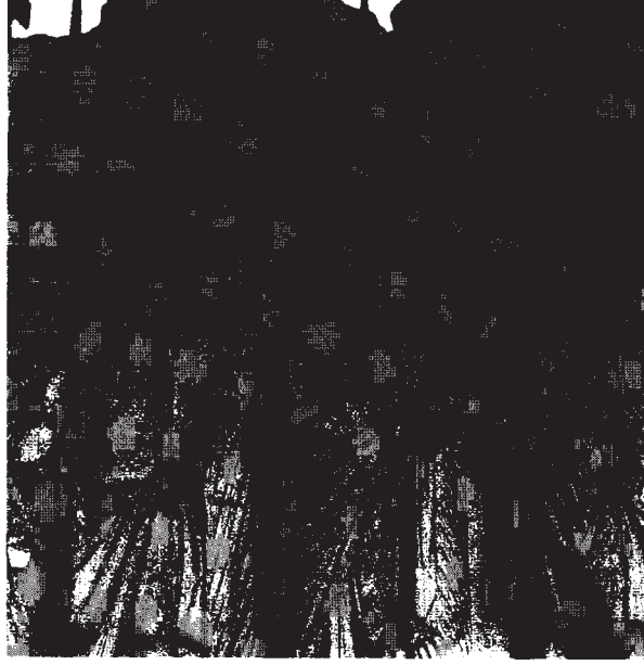
Resim 13: Gymnasium sahnesinden detay görünüş.