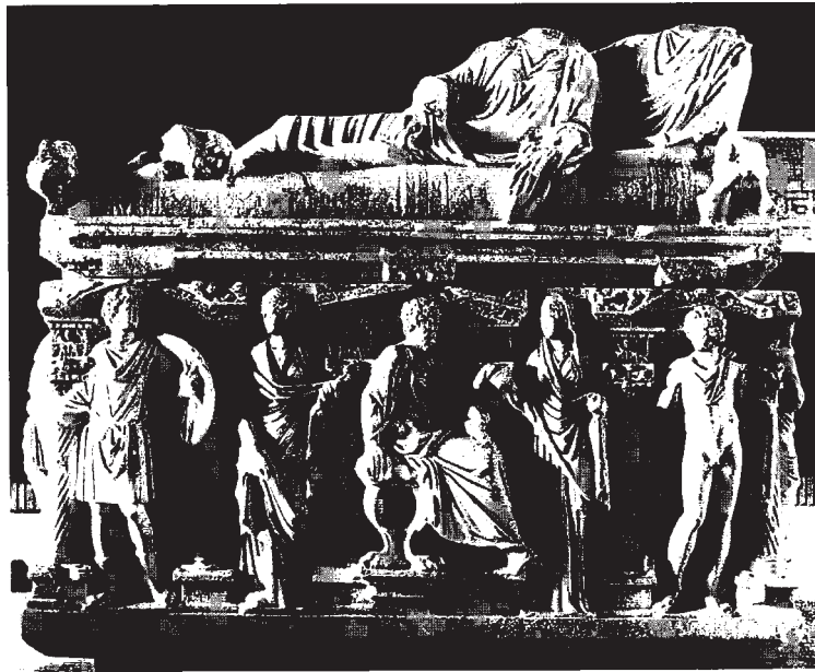
Resim 2: Ön cephe ve kapak görünüşü