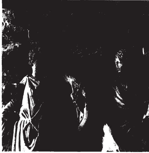
Resim 4: Savaşçı ve kadının detay görünüşü