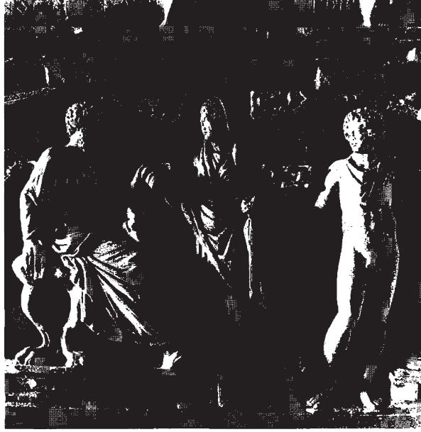
Resim 5: İskemleye (tahta) oturan sakallı figür, diademli rahibe kadın (eşi) ve genç çıplak atletin görünüşü.