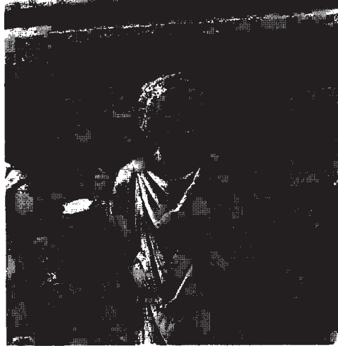
Resim 9: Dioskur'un detay görünüşü