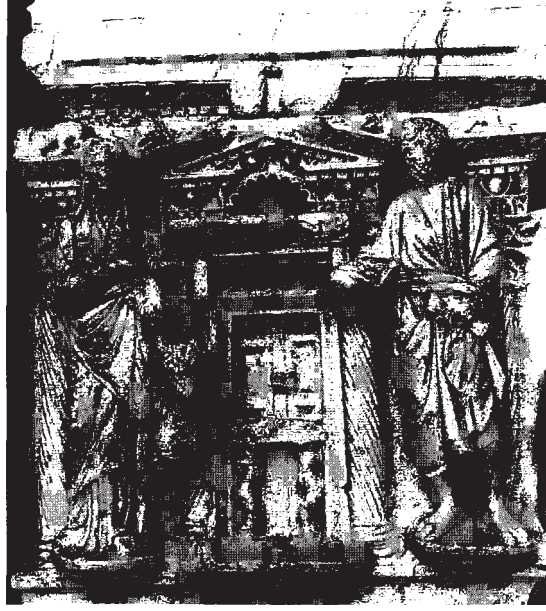
Resim11: Adak (sunu) sahnesinden detay görüntü, (rahip ve kadın)