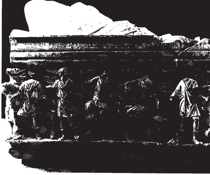
Resim 7: Arka uzun cephe ve kapağın görünüşü.