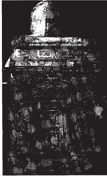
Resim 10: Kısa sağ cephe, adak (sunu) sahnesinin genel görünüşü.