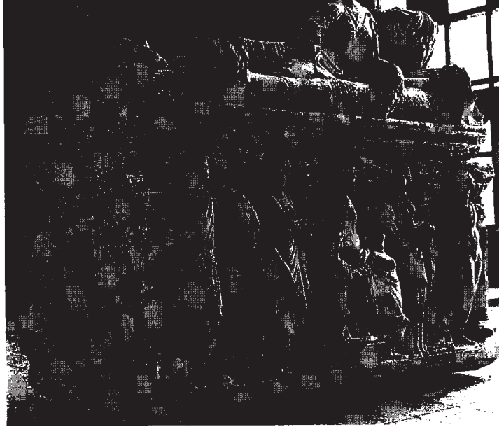
Resim 1: Lahtin ön ve kısa sol cephesinin genel görünüşü