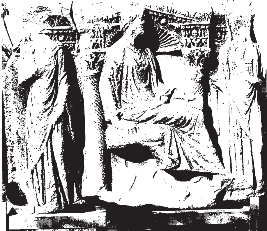
Resim 15: Hierapolis (E. 442-K. 754 no'lu G. fragmanı)