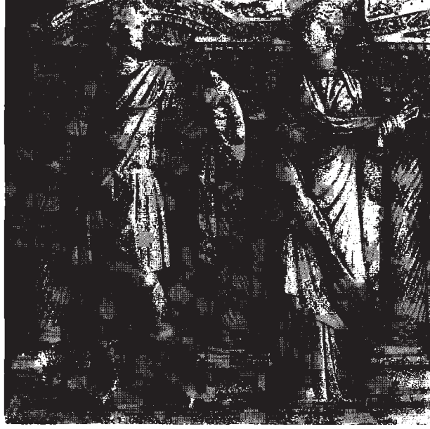
Resim 3: Ön cephede savaşı ve giyimli kadının görünüşü