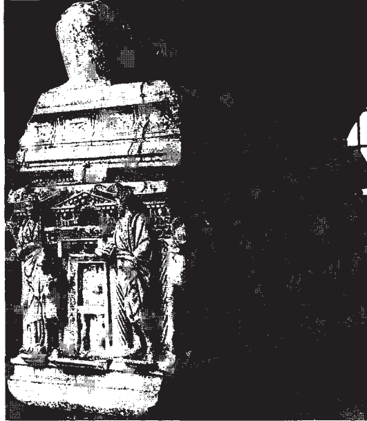
Resim 6: Arka uzun cephe, lahtın arka uzun ve kısa sağ cephesinin genel görünüşü.