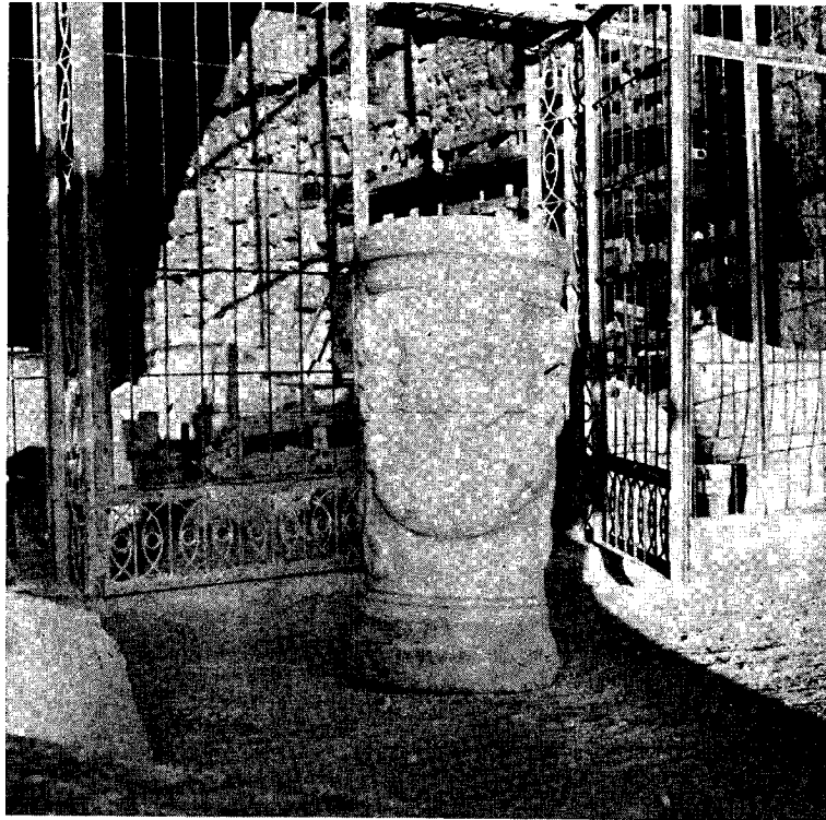
Fig. 1 - Cippe sculpte