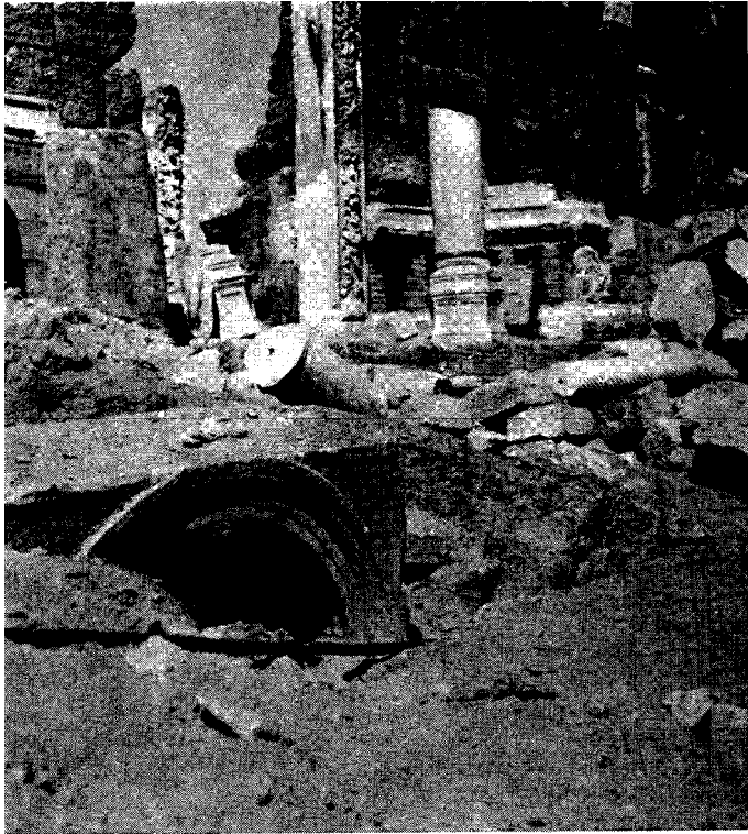
Fig. 3 - Fovilles au theatre dans la scene