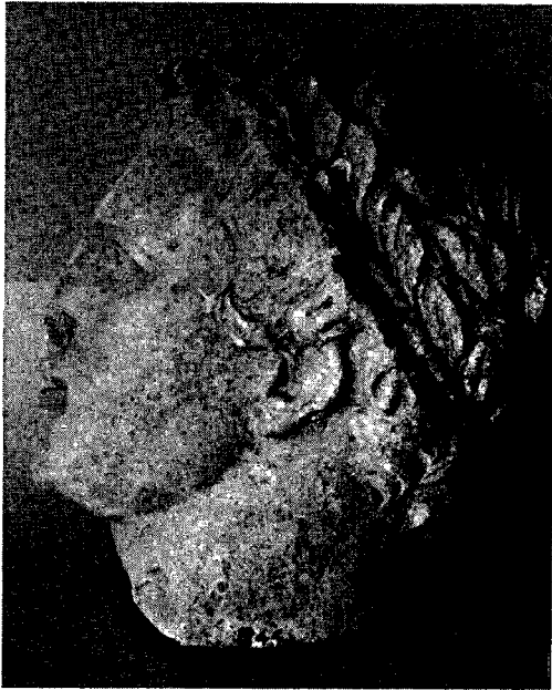
Res. 2- Portrenin yandan görünüşü.