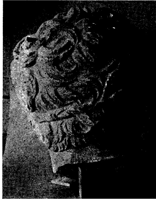
Res. 3- Portrenin arkadan görünüşü.