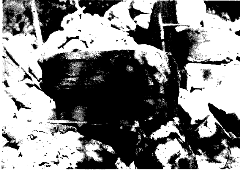
Resim: 10- Temenos. Sunak parçası