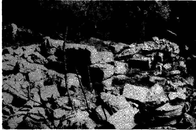
Resim: 6- Temenos. Platform ve yanda sunak parçası