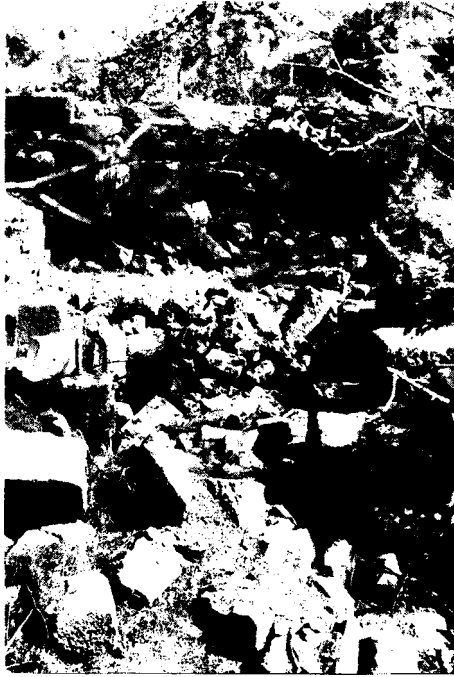
Resim: 8- Temenos. Şapel ve arkada eğrisel duvar kalıntısı