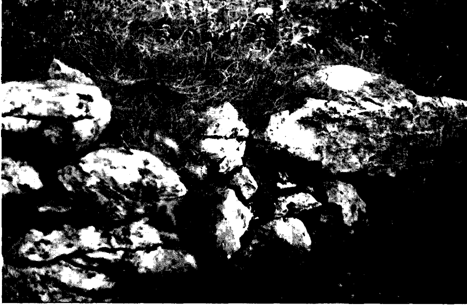
Resim: 3- Musa Dağı'na yönelen antik yol