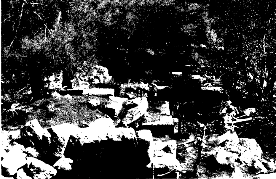
Resim: 4- Temenos. Platform ve arkada şapel