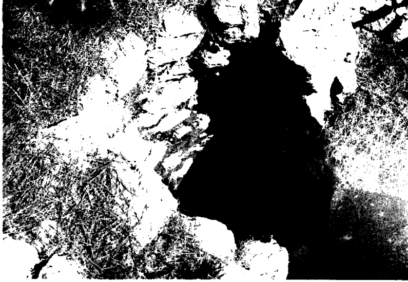
Resim: 7- Temenos. Platform içindeki çukur