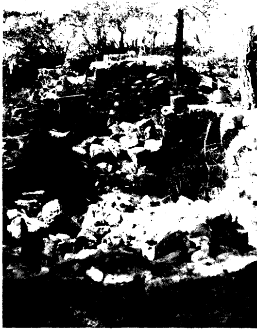
Resim: 5- Temenos. Şapel ve önde platform