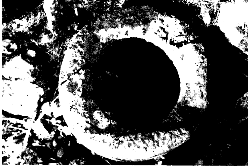
Resim: 9- Temenos. İçi oyuk yuvarlak parça