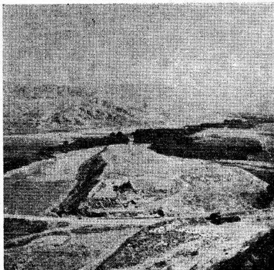
Fig. 1. Le hūyūk vu de l'Ouest.