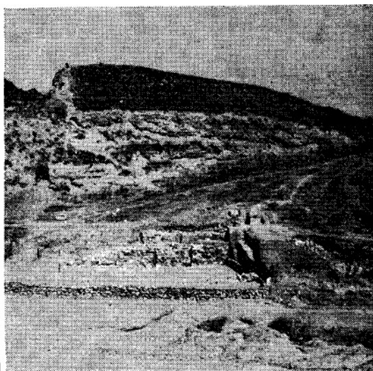
Fig. 2. Chantier I: vue d'ensemble prise du Sud-Ouest.