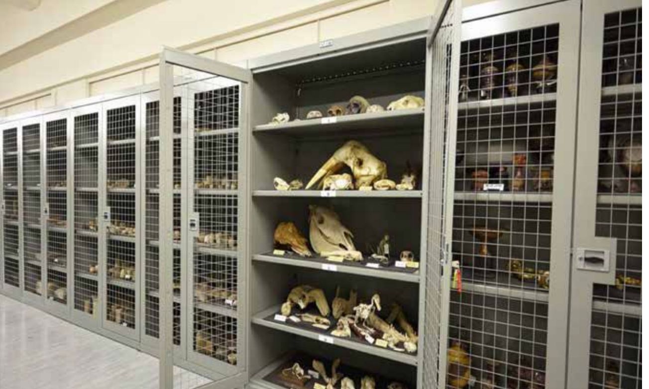
Resim 3: Birmingham Müzesi koleksiyon merkezi