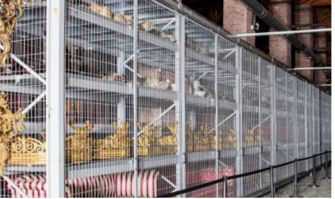
Resim 5-b: İstanbul Saray Koleksiyonları Müzesi, Depo Müze