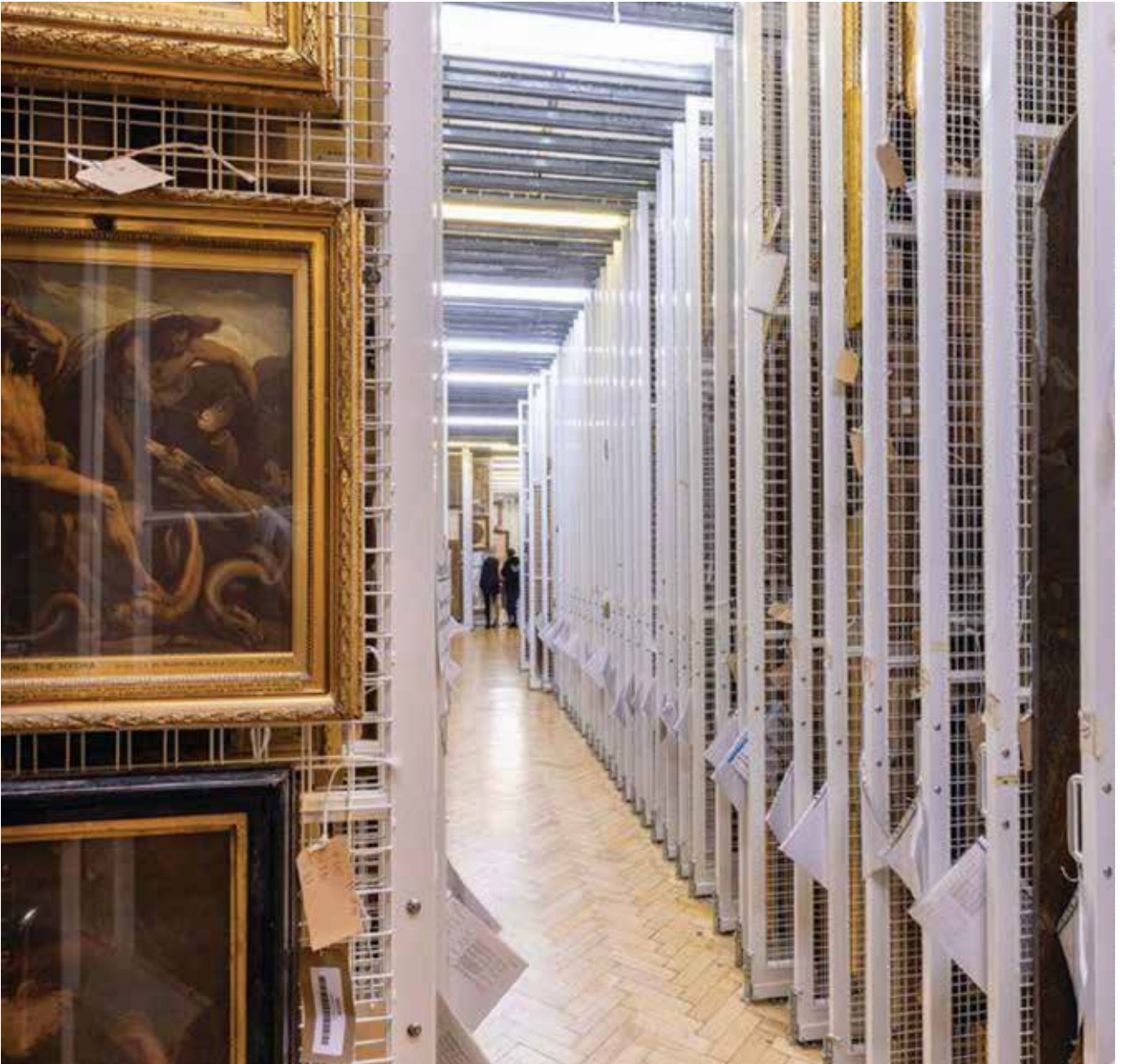
Resim 1: Blythe House, 2021

Yücel, E. (1999). Türkiye’de Müzecilik , İstanbul, Arkeoloji ve Sanat Yayınları.