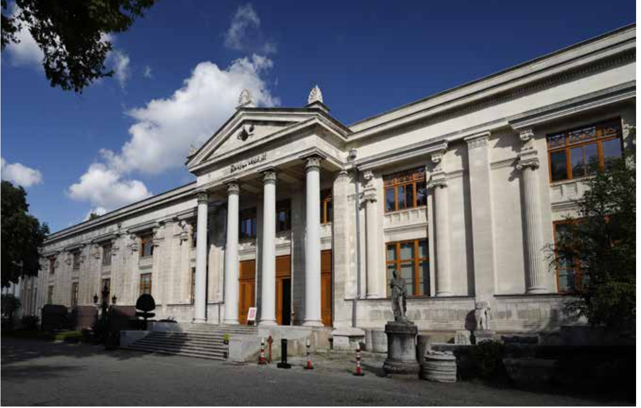
Resim 7: İstanbul Arkeoloji Müzesi