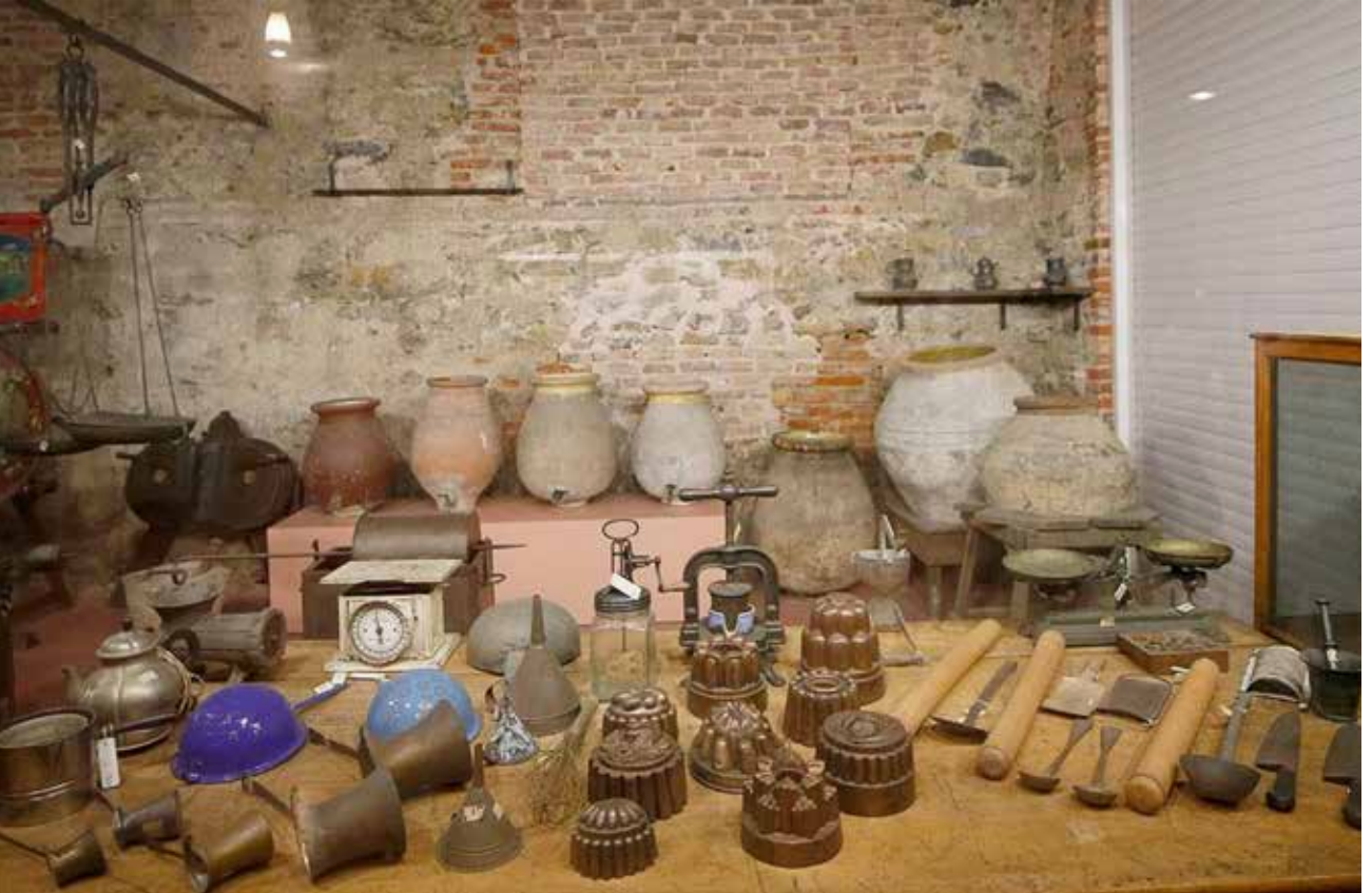
Resim 5-a: İstanbul Saray Koleksiyonları Müzesi, Depo Müze