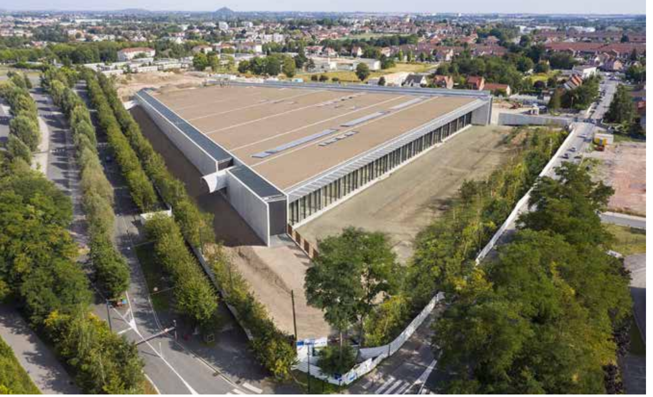
Resim 2: Louvre Koruma Merkezi