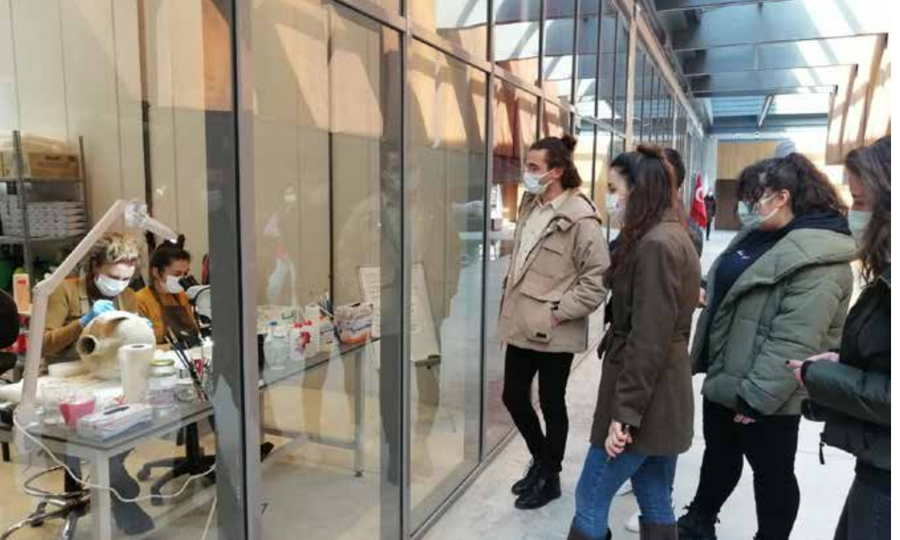
Resim 8: Troya Müzesi ve görülebilir atölye.