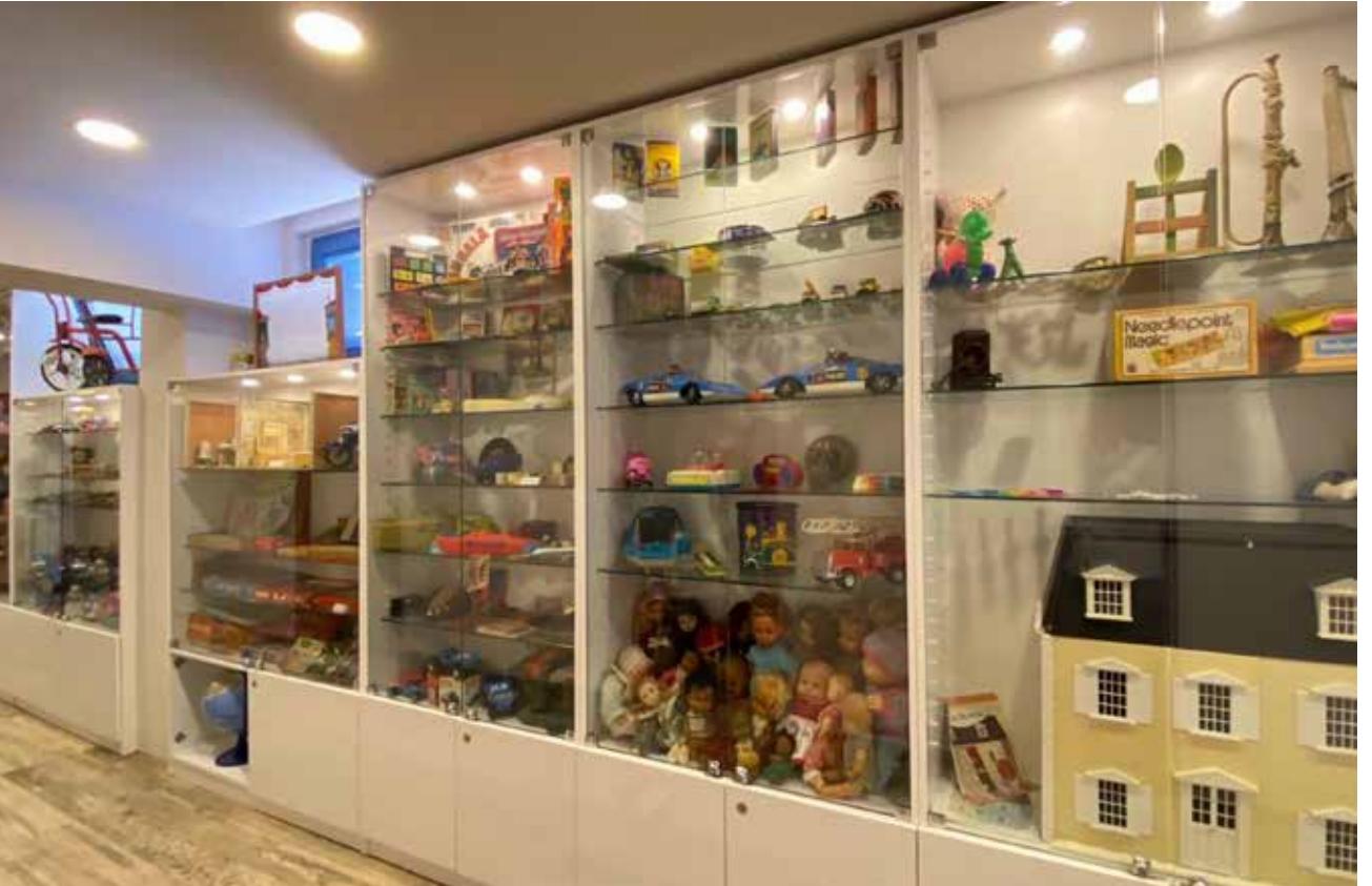
Resim 6: Antalya Kepez Dokumapark. Anadolu Oyuncak Müzesi. Depo kısmı.