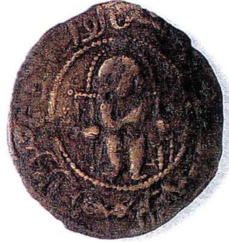
Resim : 4