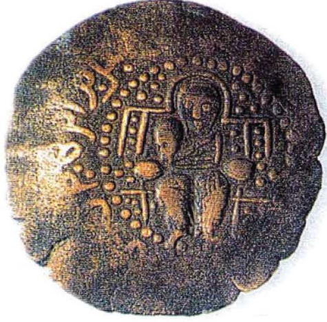
Resim : 5