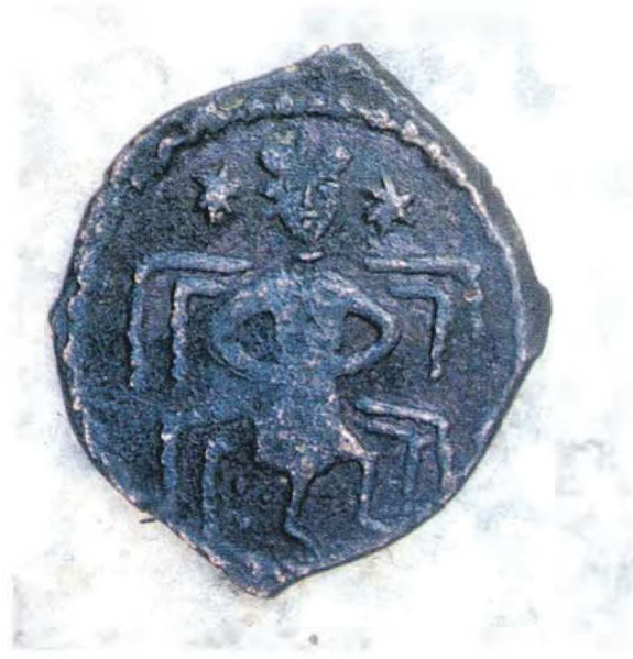
Resim : 2