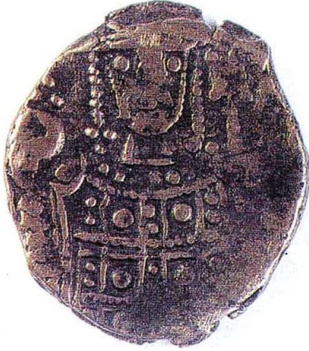
Resim : 3

Yaran), Ankara 1988, s. 343'te Selçuklu kronolojisinde "Rükneddin" veya "İzzeddin" olarak belirtilmektedir. Sikkelerinde "Es Sultanü'l Muazzam Mes'ud bin Kılıç Arslan" ibaresi yer almaktadır. "Sultanü'l Muazzam" unvanından da anlaşılacağı üzere mevcut sikkelerin bu sultana ait olma ihtimali zordur. Sikkeleri için bkz. Halit Erkiletlioğlu-Oğuz Güler, a.g.e., s.46; Lane-Poole Stanley, Catalogue of Oriental Coins in the British Museum, III, London, 1877, s. 48, no: 97; Coşkun Alptekin, "Türkiye Selçuklu Sikkelerinin İlk Örnekleri ve Bunlar Hakkındaki Bazı Mülahazalar", IV. Milli Selçuklu Kültür ve Medeniyeti Semineri Bildirileri, (25-26 Nisan 1994), Konya, 1995, s. 127-134. Konya Alaeddin Camii minber kapısında yer alan kitabesinde "İzzüd dünya ve'ddin" unvanını kullanırken, Aksaray Ulu Camii minber kapısında bu unvana yer vermemiştir. Bkz. Zeki Oral, "Anadolu'da San'at Değeri Olan Ahşap Minberler, Kitabeleri ve Tarihçeleri", Vakıflar Dergisi V, Ankara, 1962, s. 23-79.