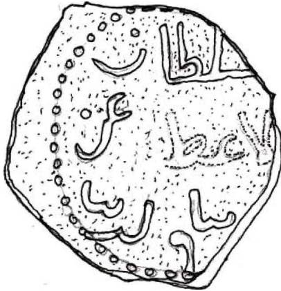
Şekil - 1

Anadolu Selçuklu Dönemi mimarî dekorasyon ve el sanatları örnekleri üzerinde yer alan insan figürleri