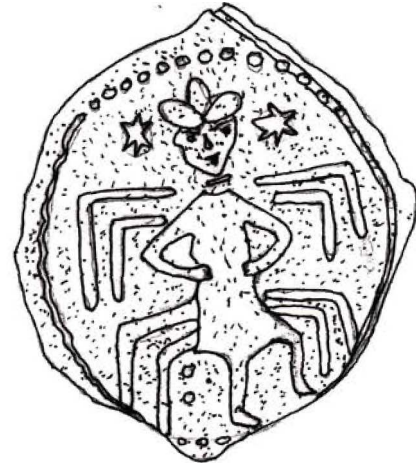
Şekil - 2