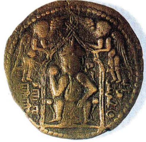
Resim : 6