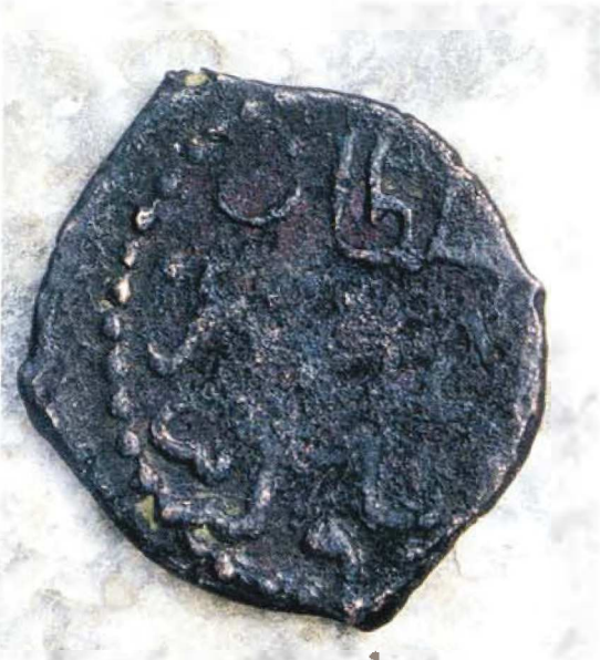
Resim : 1

Mevcut veriler ışığında, incelediğimiz sikkenin Anadolu Selçuklu Sultanı Süleyman Şah'ın altı yaşında tahta çıkan ve 1204-5 tarihinde sekiz ay gibi kısa bir süre hüküm süren, oğlu III. Kılıç Arslan'a ait olduğu kanıtlanan ilk sikke olduğunu söyleyebiliriz. Nitekim sikkenin ön yüzünde, tahtta oturan figürün, oldukça genç bir sultanı tasvir ediyor olması, bu düşüncemizi destekler. Bu figür gerek Anadolu Selçuklu Dönemi sikkeleri içerisinde, gerek diğer el sanatları örnekleri içerisinde, stil açısından benzerinin bulunmayışı ile, Anadolu Selçuklu figür repertuarına yeni bir boyut katar.