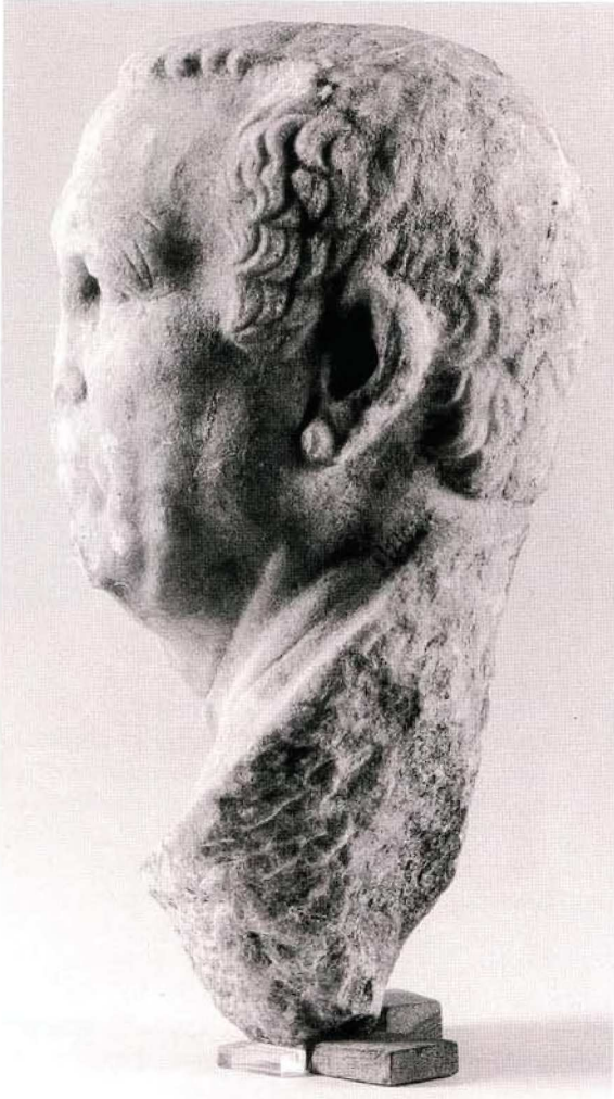
Resim : 3 Acarlar Portresi. Başın Sol Yanından Görünümü.