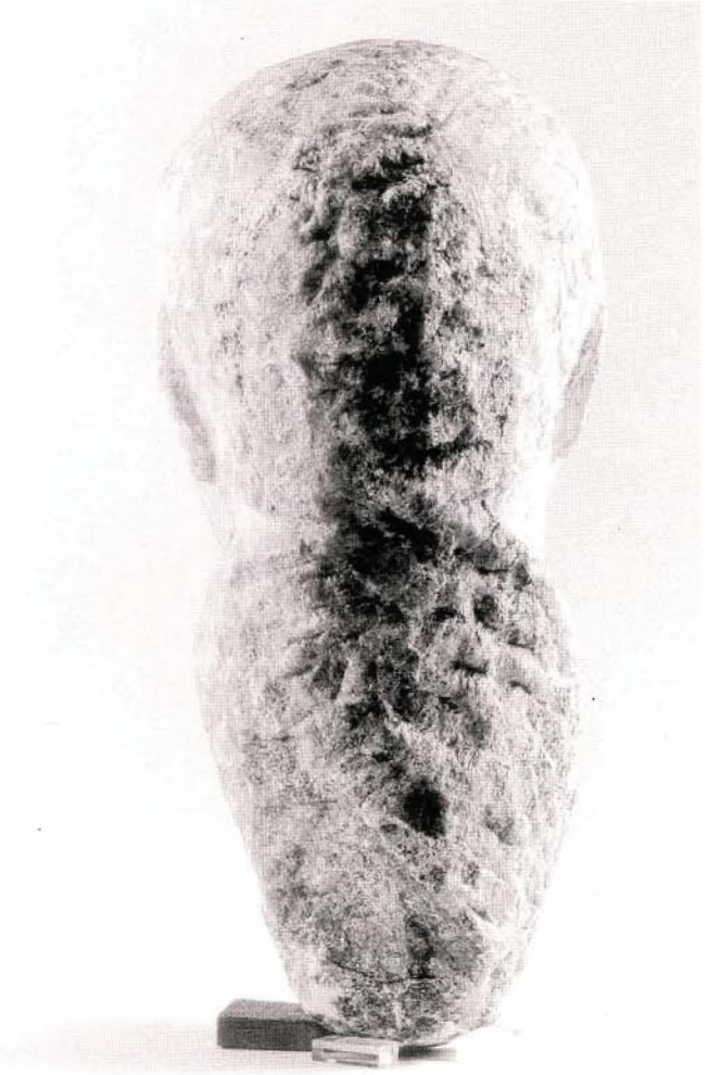
Resim : 4 Acarlar Portresi. Başın Arkadan Görünümü ve Geçki Bölümü