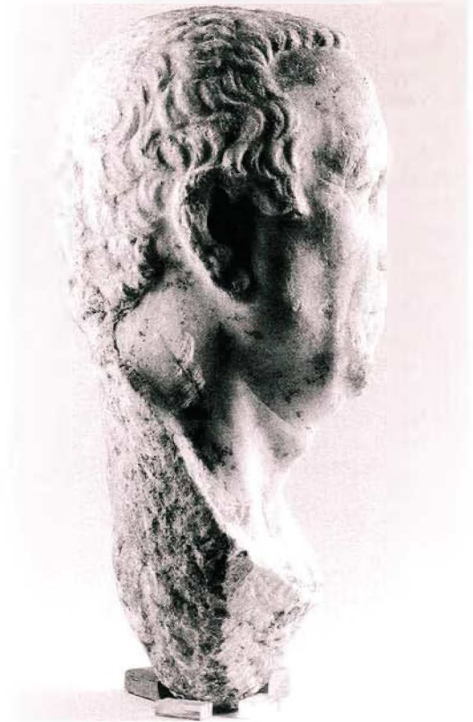
Resim : 1 Acarlar Portresi. Başın Saç Yanından Görünümü.

Sonuç olarak, Acarlar portresinde Hellenistik dönemin karakteristik patetik yüz ifadesini açıkça görmekteyiz. Ayrıca, portredeki başın hareketi Hellenistik Dönemin belirgin bir hareketidir. Başın hareketi daha çok Efes'teki örnek ve Delos portreleri stilindedir. Bilindiği gibi Delos portreleri M.Ö. 1. yüzyılın ilk yarısına tarihlenmektedir. Acarlar portresi ise, Efes Müzesi'ndeki diğer örnek gibi M.Ö. 1. yüzyılın ortası veya ikinci yarısı portre özelliklerini taşımaktadır. Acarlar portresinde daha çok Iulius ve Claudiuslar dönemi portre özellikleri görülmektedir. Bütün bu anlatımlar doğrultusunda Selçuk Acarlar Köyü portresini de M.Ö. 1. yüzyılın ikinci yarısına tarihlendirmemiz daha doğru olur kanısındayız.