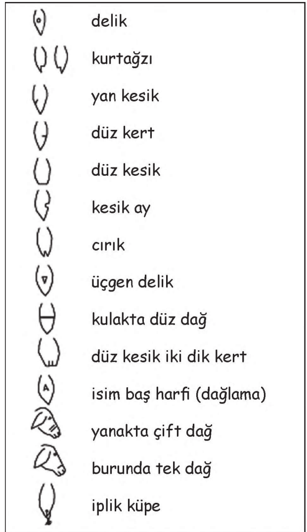
Çizim 1: Aşağı Çamlı Köyü hayvan enleri

kulağının bıçakla kesilerek, çentilerek veya delinerek yapılan işaretlerin genel adıdır (Çizim: 1).