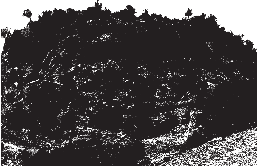
Resim 2: Akropol