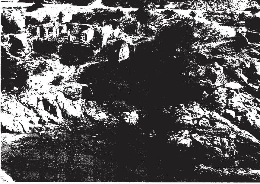
Resim 1: Küçük Liman ve antik yerleşim