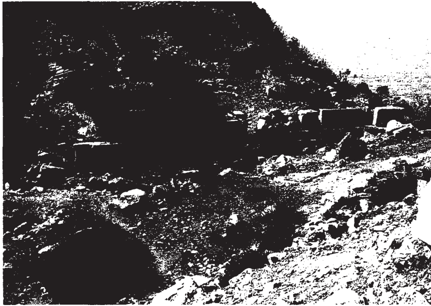
Resim 6: Liman Caddesi