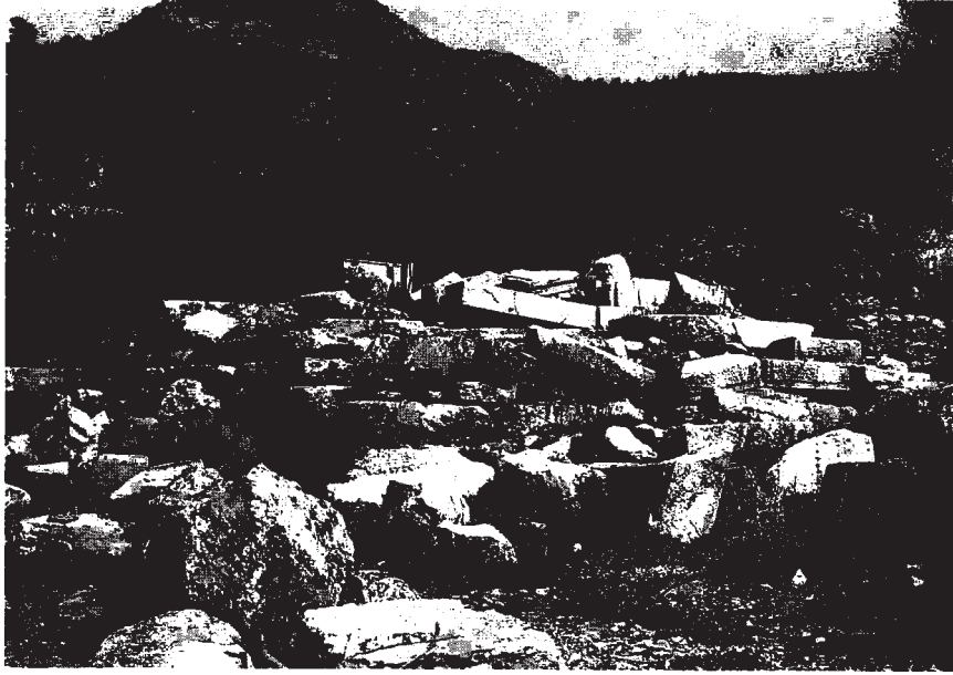
Resim 3: Tapınak