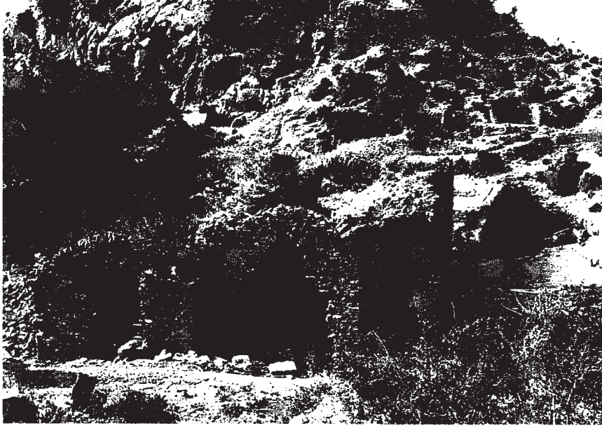
Resim 11: Hamam