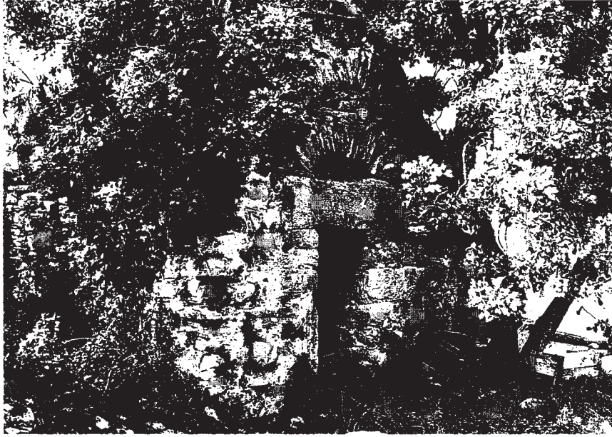
Resim 16: Anıt mezar giriři