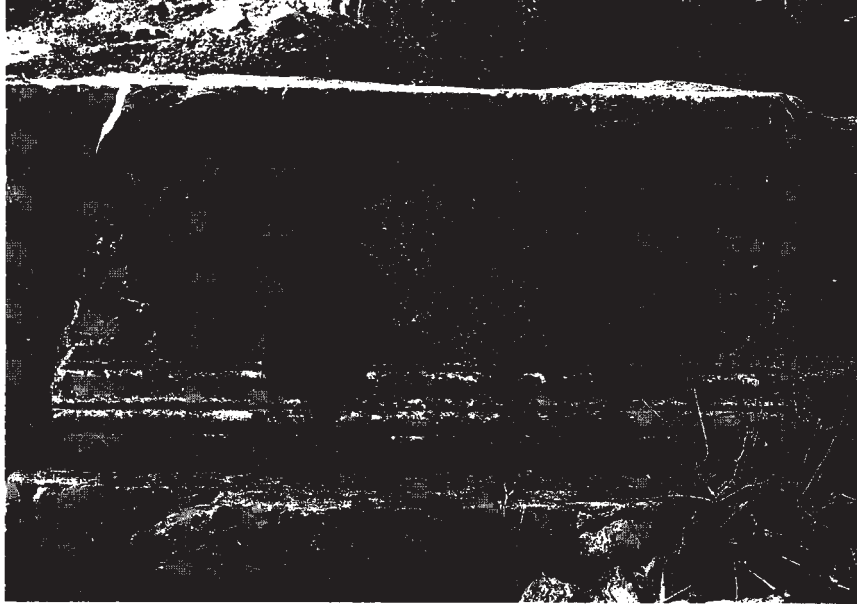
Resim 7: Yazılı kaide