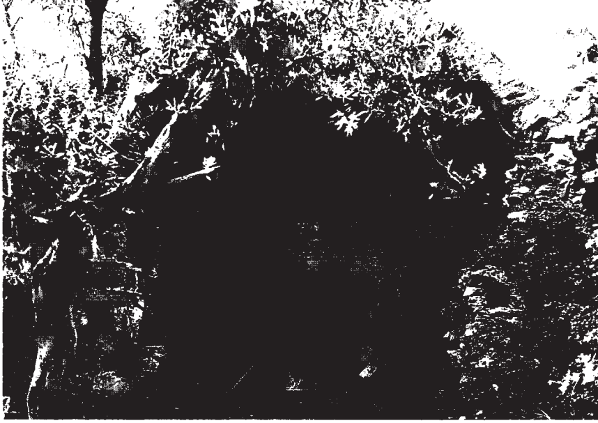
Resim 15: Anıt mezar ön odası