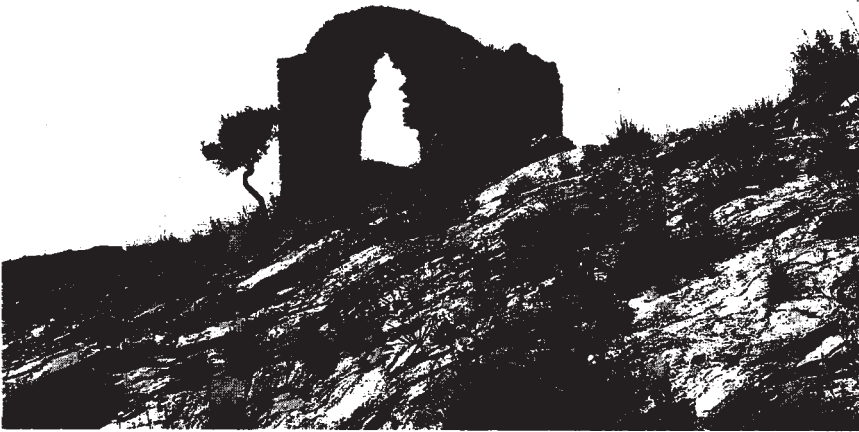
Resim 12: Anıt mezar