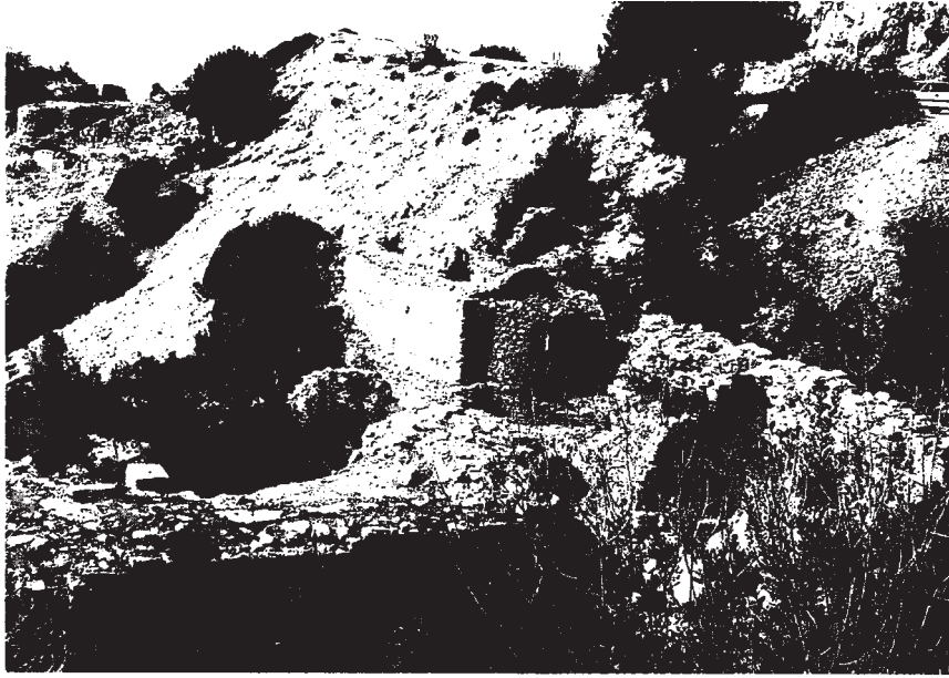
Resim 8: Şapel