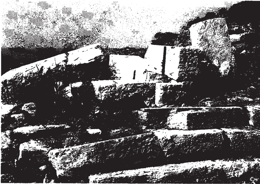
Resim 4: Tapınak