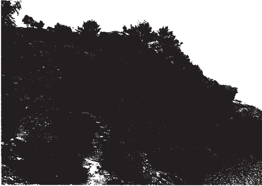
Resim 10: Hamam