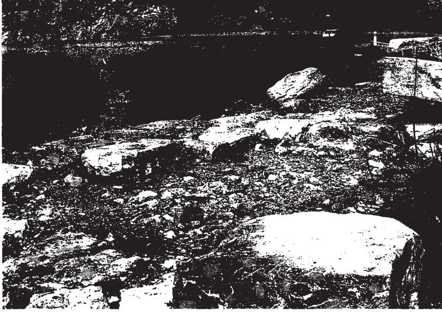
Resim 5: Tapınak