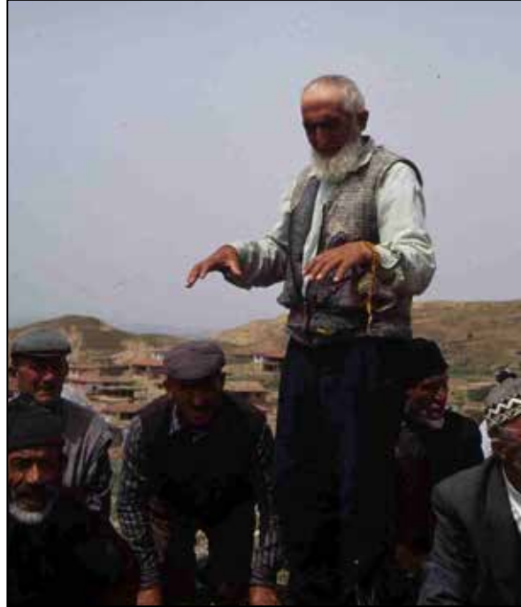
Resim 4: Yağmur Duası - Çankırı/Kızılırmak/Güneykişla Köyü