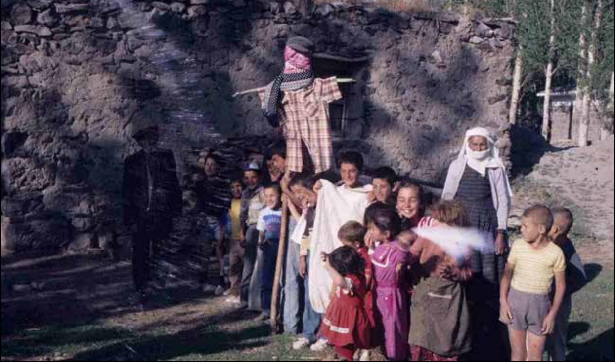
Resim 1: Bodi Oyunu - Muş/Bulanık/Güllüova Köyü