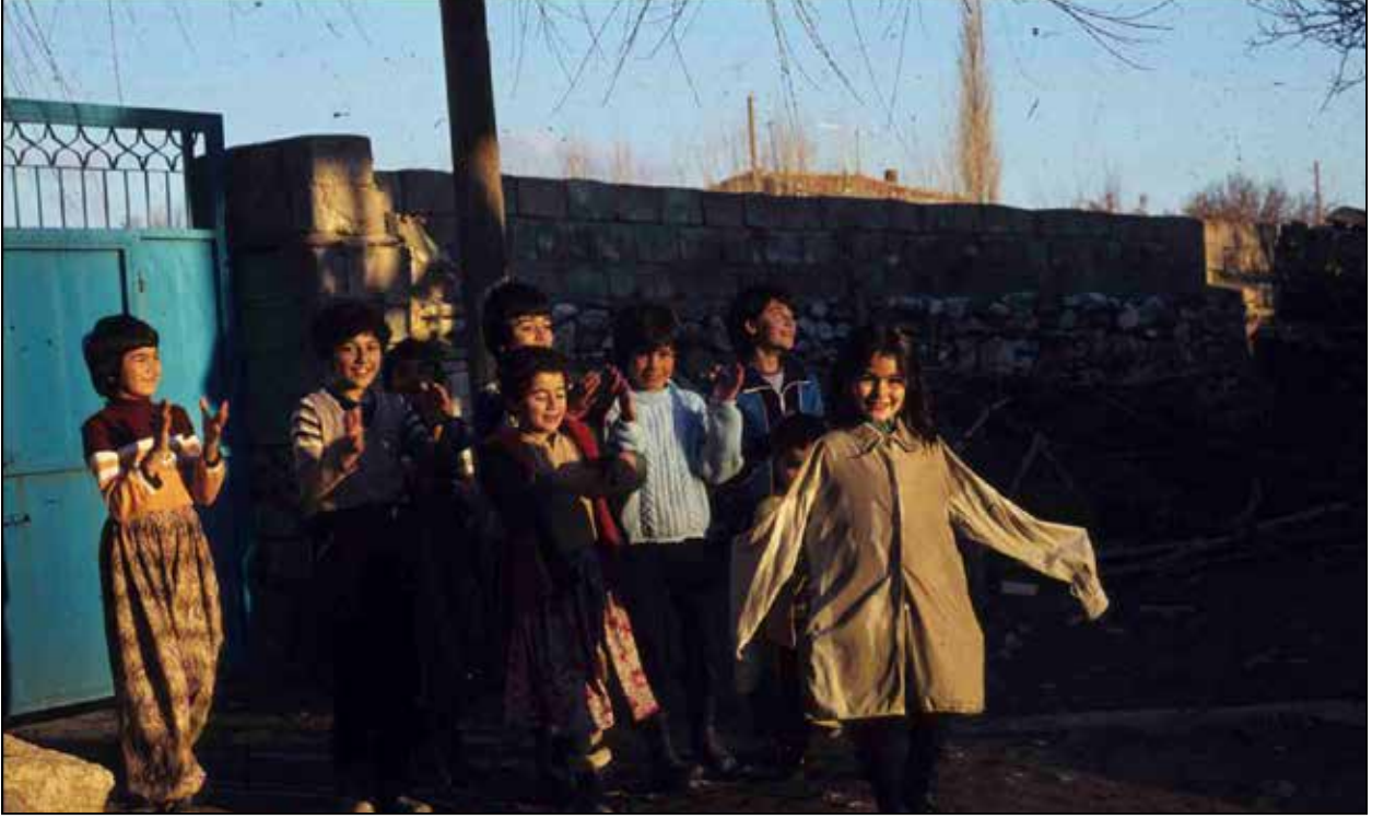
Resim 3: Yağmur Gelini-Ankara/Merkez