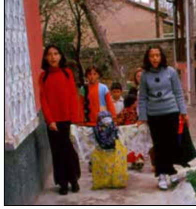
Resim 7: Udu (Bodu)Gezdirme - Kayseri/Bünyan