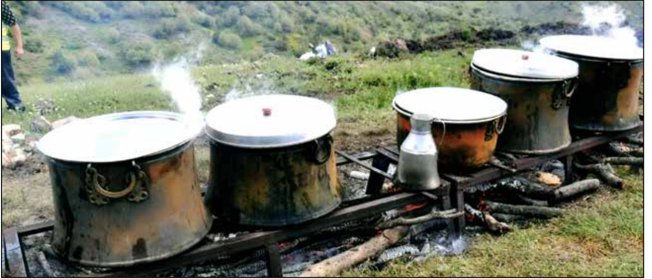
Resim 8: Yağmur Duasında Topluca Pişirilen Yemekler- Çorum/Boğazkale/Evcı Köyü