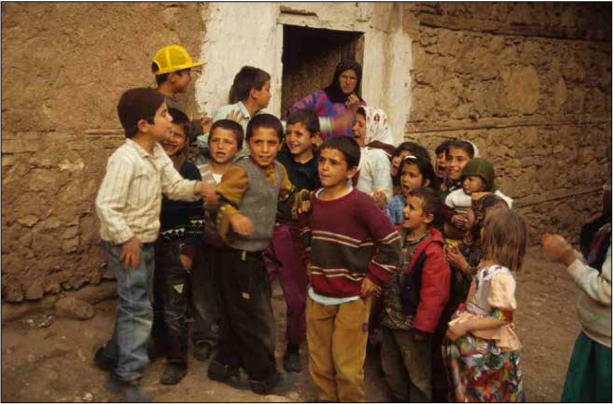
Resim 6: Yağmur Duasına Çıkmış Çocuklar -Konya/Güneysınır/Sarıhacı Köyü