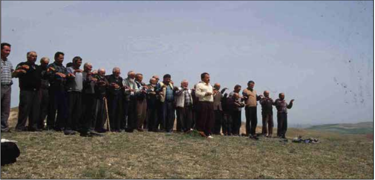
Resim 5: Yağmur Duası-Çankırı/Kızılırmak/ Güneykışla Köyü